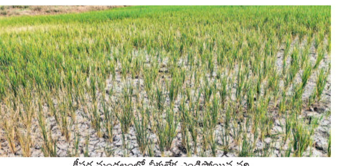
కీసర మండలంలో నీళ్లులేక ఎండిపోయిన పంట

ఉస్మానియా యూనివర్సిటీ, ఏప్రిల్ 2: విద్యార్థినులు అందరూ చదువుకోని ఉద్యోగాలు సాధించి, మహిళా సాధికారత సాధించాలని రాష్ట్ర మహిళా కమిషన్ మాజీ చైర్మన్ డాక్టర్ త్రిపురనేని వెంకటరత్నం అన్నారు. అన్ని రంగాల్లో మహిళల రాజీంపాటి అకౌంట్లించారు. అన్ని రంగాల పట్టాల గురించి తెలుసుకోవాల్సిన అవసరం ఉందని అభిప్రాయపడ్డారు. ఉస్మానియా యూనివర్సిటీ క్యాంపస్ లోని ఆంధ్ర మహిళా సభ అండ్ సైన్స్ కాలేజీ ఫర్ వుమెన్ లో బీఆర్ఎస్ అధినేతని క్యాంపస్ లోని మంగళవారం నిర్వహించారు. బీఆర్ఎస్ అండ్ సైన్స్ కాలేజీ ఫర్ వుమెన్ లో బీఆర్ఎస్ అధినేతని క్యాంపస్ లోని మంగళవారం నిర్వహించారు. బీఆర్ఎస్ అండ్ సైన్స్ కాలేజీ ఫర్ వుమెన్ లో బీఆర్ఎస్ అధినేతని క్యాంపస్ లోని మంగళవారం నిర్వహించారు. బీఆర్ఎస్ అండ్ సైన్స్ కాలేజీ ఫర్ వుమెన్ లో బీఆర్ఎస్ అధినేతని క్యాంపస్ లోని మంగళవారం నిర్వహించారు.