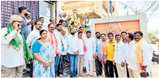
బిలుకాపానగర్ డివిజన్లో సర్దార్ సర్కారు పాపన్న గౌడ్ విగ్రహానికి ప్రజలమాల వేసి నివాళులర్పిస్తున్న నాయకులు