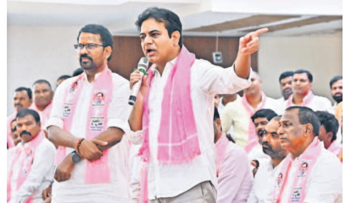
శాశ్వతపేటలో జరిగిన సమావేశంలో మాట్లాడుతున్న పార్టీ వర్గం ప్రెసిడెంట్ కేటీఆర్

మంచికి పుట్టిన బిడ్డలను తన బిడ్డలుగా చెప్పుకుంటున్న తీరుగా రేవంట్ వ్యవహారం ఉన్నదని, మూడు నెలల్లోనే 30 వేల ఉద్యోగాలు ఇచ్చామని చెప్పుకోవడమే ఇందుకు నిదర్శనమని కేటీఆర్ ఎద్దేవా చేశారు. మూడు నెలల్లోనే నోటిఫికేషన్ల ఎప్పుడు ఇచ్చారో, పరీక్షలు