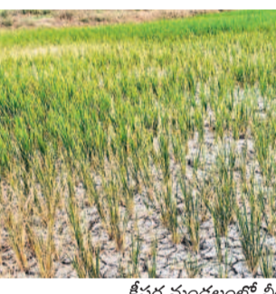
కీసర మండలంలో నీళ్లులేక ఎండిపోయిన వరి