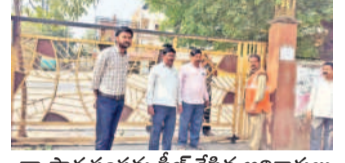
వ్యాపార సంస్థను సీజ్ చేసిన అధికారులు

మేడ్చల్, ఏప్రిల్ 2: ట్రేడ్ లైసెన్స్ లేకుండా వ్యాపారం నిర్వహిస్తే చర్యలు తీసుకుంటామని కమిషనర్ నాగిరెడ్డి తెలిపారు. మేడ్చల్ మున్సిపాలిటీ పరిధిలో లైసెన్స్ లేకుండా వ్యాపారం నిర్వహిస్తున్న సంస్థలను మంగళవారం కమిషనర్ సీజ్ చేశారు. ఈ సందర్భంగా ఆయన మాట్లాడుతూ.. పురపాలక సంఘ చట్టం 2019 ప్రకారం విధిగా ట్రేడ్ లైసెన్స్ ఉండాలి. లైసెన్స్ లేకుండా వ్యాపారం నిర్వహించడం చట్టవిరుద్ధం నేరమని తెలిపారు. ఏడు బోల్డో లైసెన్స్ లు లేని ప్రతి ఒక్కరూ పొందాలని ఆయన సూచించారు. అసెలైన్ డ్యారూ నేరుగా కూడా లైసెన్స్