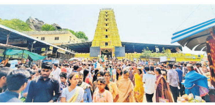
రాజగోపురం వద్ద భక్తుల రద్దీ

■ కొనసాగుతున్న బ్రహ్మాత్మ వాలు ■ 11వ అదివారం 50వేల మంది భక్తుల దర్శనం