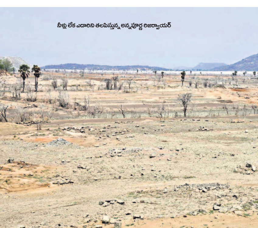
నీళ్లు లేక ఎడారిని తలపిస్తున్న అన్నపూర్ణ రిజర్వాయర్