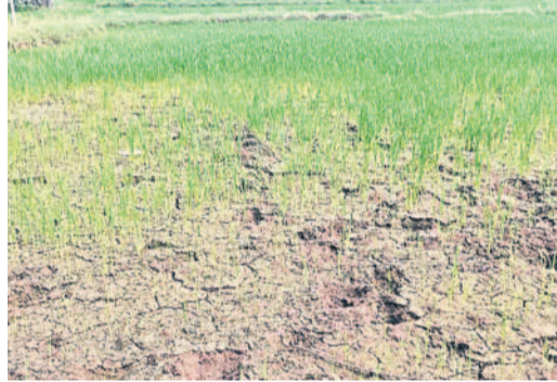
నీళ్లు లేక ఎందుకున్న పరి పంట

దస్తూరాబాద్, మార్చి 31: రోజురోజుకూ ఎండలు పెరుగుతుండడంతో చెరువులు, వాగులు, బోర్లు, వ్యవసాయ బావుల్లో భూగర్భజలాలు అడుగంటుతున్నాయి. పంటలు చేతికొచ్చే సమయంలో ఎండిపోతుండడంతో రైతులకు దిగులు తప్పడం లేదు. యాసంగి సీజన్ లో వ్యవసాయ బావులు, బోర్లు బావుల్లో నీరుంటుందని ఎంతో ఆశతో రైతులు పరి పంటను వేశారు. కానీ కాలం కలిసి రాక రైతుల ఆశలు అమిరవుతున్నాయి. యాసంగిలో పరి పంటలకు నీరు లేక నెర్రెలుబారి ఎండిపోయే స్థితికి వచ్చాయి. గతేడాది యాసంగిలో నీళ్లు పుష్కలంగా ఉండడంతో పంటలు బాగా పండాయి. ఈ ఏడాది వానకాలంలో వర్షాలు అంతంత మాత్రంగానే కురియడంతో, భూమిలోకి నీరు పూర్తి సామర్థ్యం చేరలేదు. భూగర్భ జలాలు అడుగంటిపోయి బోర్లు బావుల నుండి నీరు రావడం లేదు. దీంతో చేసిన పరి పుష్కల ఎండిపోయే పరిస్థితికి వచ్చింది. యాసంగి ప్రాంతంలో వ్యవసాయ బావులు, బోర్లు పుష్కలంగా నీరు ఉండడంతో రైతులు ఎక్కువగా పరి పంటను సాగు చేశారు. తీరా కలుపు తీసి సమయానికి నీళ్లు తగ్గి పంటలు ఎండిపోయే దశకు చేరుకున్నాయి. పంట చేతికొచ్చేందుకు ఇంకా రెండు నెలల