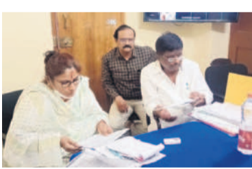
తనిఖీ చేస్తున్న అధికారులు