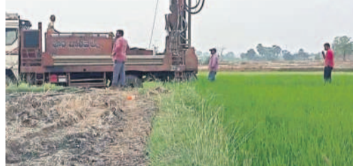
నీళ్లు సరిపోక పొలంలోనే బోర్లు వేయిస్తున్న రైతులు

పొలాలు ఎండిపోయే స్థితికి రావడంతో రైతులు భగీరథ ప్రయత్నం చేస్తున్నారు. వ్యవసాయ బావుల్లో పూడిక తీపిస్తున్నారు. అయినా ఫలితం శూన్యం. ఖర్చులు మీద పడుతున్నాయి తప్పని, నీళ్లు ఊరడం లేదు. కొన్ని చోట్ల పంట పొట్ల దశకు చేరుకోవడంతో, దానిని కాపాడుకోవడానికి వేల రూపాయలను ఖర్చు చేసి బోర్లను రైతులు చేపిస్తున్నారు. గత పదేళ్లలో ఎన్నడూ లేని భూగర్భ విద్యుత్ విద్యుత్ రైతులు బోర్లను తమ పంట పొలాలు వద్ద చేపిస్తున్నారు. గత పదేళ్లలో వ్యవసాయ బావుల్లో పూడిక తీసి అలోచన లేకుండా, కానీ ఈ యాసంగిలో ఎక్కడ చూసినా వ్యవసాయ బావుల్లో పూడిక తీసిన పని కనిపిస్తుంది. వ్యవసాయ బావులు, బోర్లలో నీళ్లు ఎప్పుడూ తగ్గిపోతాయే తెలియని పరిస్థితి. ఒక్క తడిక కూడా నీళ్లు సరిపోవడం లేదు. పొలం వద్దనే రైతులు పడిగాపులు కానీ నీళ్లు ఊరిన తర్వాత మోలారు వేసి పంటకు నీళ్లు పోలిస్తున్నారు. పరి సాగు చేసిన సమయం తప్పని ప్రభుత్వం ఆదుకోవాలని రైతులు కోరుతున్నారు.