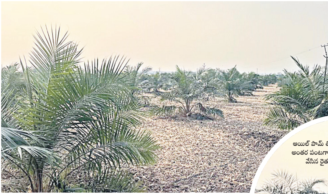
దిలావర్ పూర్. న్యూ డోలంలో ఆయిల్ పామ్ తోట