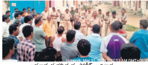
అవగాహన కల్పిస్తున్న పోలీస్ అధికారులు