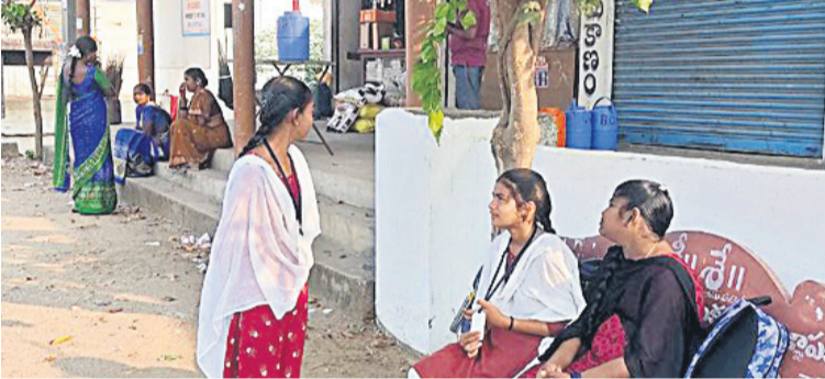
రేవోజిపేటలో బస్ స్టాప్ ను వేసి చూస్తున్న ప్రయాణికులు, విద్యార్థులు