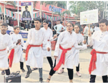
అవగాహన కల్పిస్తున్న కళాకారులు

నిర్మల్ చైన్ గేట్, మార్చి 31: జిల్లా కేంద్రంలోని ఇందిరానగర్ కార్యాలయల మార్కెట్ వద్ద సీ ఈఈ అధ్యక్షులతో ప్లాస్టిక్ వాడకంలో కలిగి అనర్హత కళా ప్రదర్శన నిర్వహించారు. ఈ సందర్భంగా సభ్యులు ప్లాస్టిక్ వాడకం వల్ల వచ్చే దుష్పరిణామాల్పై అవగాహన కల్పించారు. ప్లాస్టిక్ ను నిషేధించి చేతి సంయమన వాదనలను అవగాహన కల్పించారు. కార్యక్రమంలో సంస్థల ప్రతినిధులు, కళాకారులు పాల్గొన్నారు.