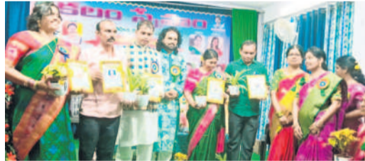
కవులను సన్మానిస్తున్న నిర్మాణాధికారులు