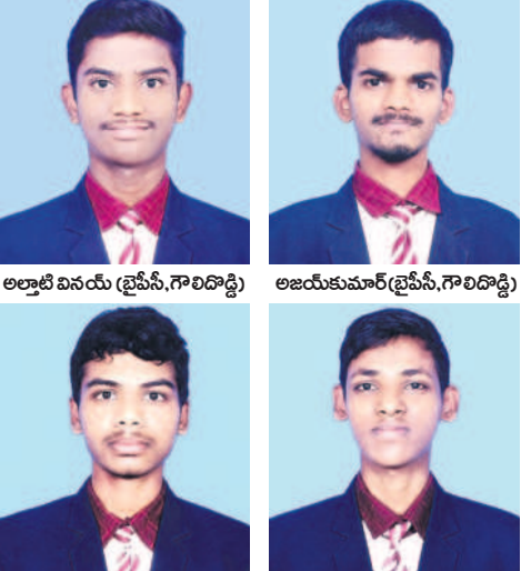
డి సాయిధర్షణ (బ్రెవీస్, గాలిదొడ్డి) గుమ్మడి ఉజ్వల్ (బ్రెవీస్, గాలిదొడ్డి)

ప్రీమియర్ సీవోఈల్లో 14 సీట్లు సాధించిన విద్యార్థులు