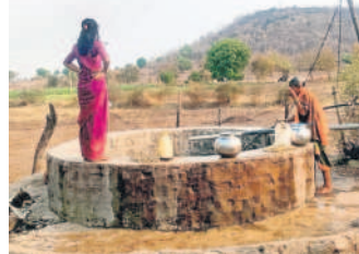
బావి వద్ద నీరు తోడుతున్న మహిళలు

తాంసీ, మార్చి 31 : మండలంలోని గిరి గామ, అట్లంగూడ, లింగూడ గ్రామాలకు మిషన్ భగీరథ జలం నాలుగు రోజులుగా సరఫరా కావడం లేదు. భూగర్భజలాలు అడుగంటడంతో బోర్లలో నీరు ఇంకిపోయి గిరిపుత్రులు అప్పు కష్టాలు పడుతున్నారు. ఇటీవల తలమడుగు మండలంలోని లక్ష్మీపూర్ గ్రామ స్థూల కలెక్టర్ రాజ్ కేంద్రం తమ నీటి సమస్యను పరిష్కరించాలని విన్నవించుకున్నారు. కలెక్టర్ సంబంధిత అధికారులకు భగీరథ సమస్యలను పరిష్కరించి అన్ని గ్రామాలకు నీరు అందేలా చూడాలని ఆదేశాలు జారీ చేశారు. అయినా అధికారులు పట్టించుకోకపో