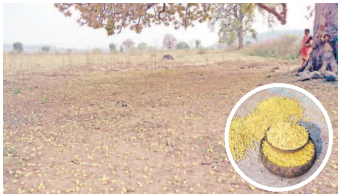
చెట్టు కింద ఇప్ప పూలు