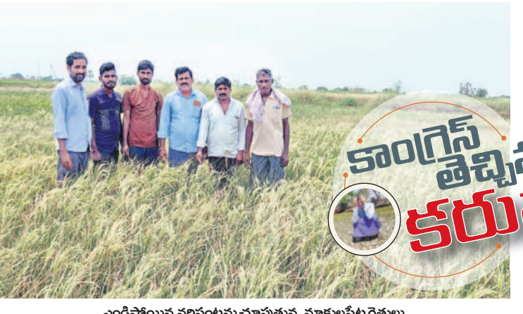
ఎండిపోయిన వరిపంటను చూపుతున్న మాకులపేట రైతులు

● లక్షలు ఖర్చు పెట్టి పూడిక తీసినా ఫలితం శూన్యం ● గంట కూడా నడవని మోటర్లు.. ● పొట్ట దశలో ఎండుతున్న వరి ● ఇప్పటికే పలుచోట్ల పశువులు మేతకు వదిలేసిన వైనం ● అగమ్యగోచరంగా రైతన్నల పరిస్థితి ● ప్రభుత్వమే ఆదుకోవాలని వేడుకోలు