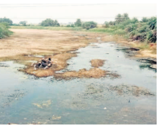
నీరు లేక వెలవెలబోతున్న చెక్ డ్యాం

నాడు కళకళ.. నేడు వెలవెల.. ● అడుగంటిన చింతలమానేపల్లి చెక్ డ్యాం ● నాడు రంది లేకుంటే రెండు పంటలు ● ప్రస్తుతం వారులో నీటికోసం జీసీసీలతో తవ్వకాలు చింతలమానేపల్లి, మార్చి 31 : నాలుగేళ్ల తీవ్ర చింతలమానేపల్లి సమీపంలోని వాగుపై చెక్ డ్యాం నిర్మించగా, ప్రస్తుతం పూర్తిగా అడుగంటిపోయింది. బీఆర్ఎస్ సర్కారు ప్రత్యేక చొరవతో ఏర్పాటు చేసిన ఈ చెక్ డ్యాం కింద రైతులు రంది లేకుండా యేటా రెండు పంటలు తీస్తూ వచ్చారు. నాడు నందుకుండలా కళకళలాడిన ఈ చెక్ డ్యాం.. నేడు కాంగ్రెస్ ప్రభుత్వ పట్టించుకోలేనంతో చుక్క నీరు లేక వెలవెలబోతున్నది. దీనిపై ఆదారపడి 50 ఎకరాల్లో వేసిన వరి, మిరప, మళ్లీ చేతికందకుండా పోయే దుస్థితి నెలకొంది. పంట చేతికొచ్చే దశలో ఈ పరిస్థితి తలెత్తడంతో రైతులు వాగులో జీసీసీలతో గుంతలు తవ్వించి అందులో మోటర్లు బిగించి పంటలకు నీరందించే ప్రయత్నం చేస్తున్నారు.