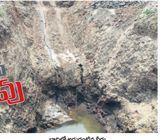
బావిలో అడుగంటిన నీరు

దండేపల్లి, మార్చి 31 : మరో నెల రోజుల్లో పంట చేతి కొస్తుందిని ఆశపడ్డ జిల్లా రైతాంగానికి చివరకు నిరాశే మిగులుతున్నది. కడెం నీరందక.. భూగర్భ జలాలు అడుగంటి పొట్ట దశలో ఉన్న వరి కళ్లముందే ఎండుతుండగా దిక్కుతోచని పరిస్థితి నెలకొంది. గతేడాది రంది లేకుండా రెండు పంటలు తీసిన అన్నదాతలు, ఈసారి తీవ్రంగా నష్టపోయే దుస్థితి దాపురించింది. అడుగంటిన భూగర్భ జలాలు మంచీర్యాల జిల్లాలో యానంగిలో 62,524 ఎకరాల్లో వరి పొగ వేశారు. 50 శాతం మేర సన్నాలు, మరో 50 శాతం మేర దొడ్డు రకం పంటలు వేశారు. గతేడాది అక్టోబర్ చివరి వరకు ఆశించిన మేర వర్షాలు కురవడంతో గ్రామాల్లోని చెరువులు, కుంటలు జలశకనం సంతరించు