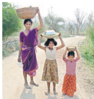
అడవి నుంచి ఇప్ప పూలు సేకరణం తీసుకొస్తున్న గిరిజన కుటుంబం

కుప్రం బీం అసిఫాబాద్, మార్చి 31 (నే మస్తి తెలంగాణ) : అడవితల్లి ప్రసాదించిన ఇప్పపూల సేకరణ ప్రారంభమైంది. ఆదివాసులు కోడి కూయక ముందే లేచి అడవి బాట పడుతున్నారు. ఈ ఏడాది వర్షాలు ఎక్కువగానే పడగా, ఇప్పపూలు ఎక్కువగానే పూశాయి. ఎండాకాలంలో నెల రోజుల పాటు జీవనోపాధి కల్పించే ఇప్పపూల సేకరణలో అడవివిడ్లలు నిమగ్నమయ్యారు.