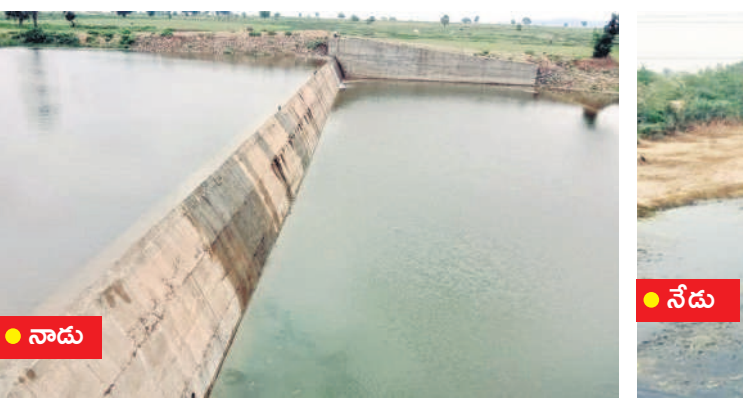
నాడు కళకళ.. నేడు వెలవెల..

నాడు కళకళ.. నేడు వెలవెల.. ● అడుగంటిన చింతలమానేపల్లి చెక్ డ్యాం ● నాడు రంది లేకుంటే రెండు పంటలు ● ప్రస్తుతం వారులో నీటికోసం జీసీసీలతో తవ్వకాలు చింతలమానేపల్లి, మార్చి 31 : నాలుగేళ్ల తీవ్ర చింతలమానేపల్లి సమీపంలోని వాగుపై చెక్ డ్యాం నిర్మించగా, ప్రస్తుతం పూర్తిగా అడుగంటిపోయింది. బీఆర్ఎస్ సర్కారు ప్రత్యేక చొరవతో ఏర్పాటు చేసిన ఈ చెక్ డ్యాం కింద రైతులు రంది లేకుండా యేటా రెండు పంటలు తీస్తూ వచ్చారు. నాడు నందుకుండలా కళకళలాడిన ఈ చెక్ డ్యాం.. నేడు కాంగ్రెస్ ప్రభుత్వ పట్టించుకోలేనంతో చుక్క నీరు లేక వెలవెలబోతున్నది. దీనిపై ఆదారపడి 50 ఎకరాల్లో వేసిన వరి, మిరప, మళ్లీ చేతికందకుండా పోయే దుస్థితి నెలకొంది. పంట చేతికొచ్చే దశలో ఈ పరిస్థితి తలెత్తడంతో రైతులు వాగులో జీసీసీలతో గుంతలు తవ్వించి అందులో మోటర్లు బిగించి పంటలకు నీరందించే ప్రయత్నం చేస్తున్నారు.