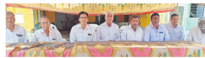
సోమకృష్ణపేట పీఠిసీఎస్ సర్కల్ ధర్మారెడ్డి, సభ్యులు