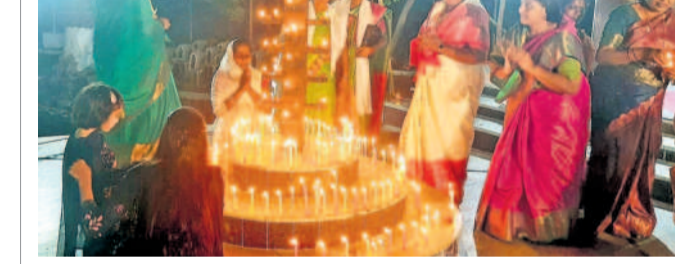
మెడక్ చర్చిలో నిలువ వర్ణ కొవ్వొత్తులు వెలిగిస్తున్న మహిళలు