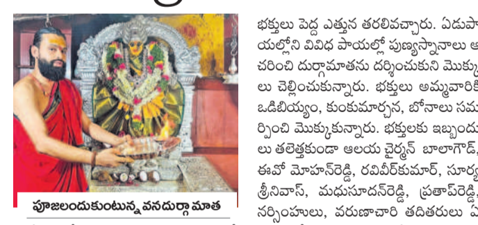
పూజలందుకుంటున్న వనదుర్గా మాత