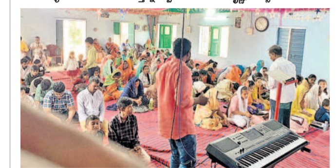
చేగుంట వద్ద చర్చిలో ప్రార్థనలు చేస్తున్న పాపర్లు ప్రముఖులు, శాంతి, శ్రేస్తపులు