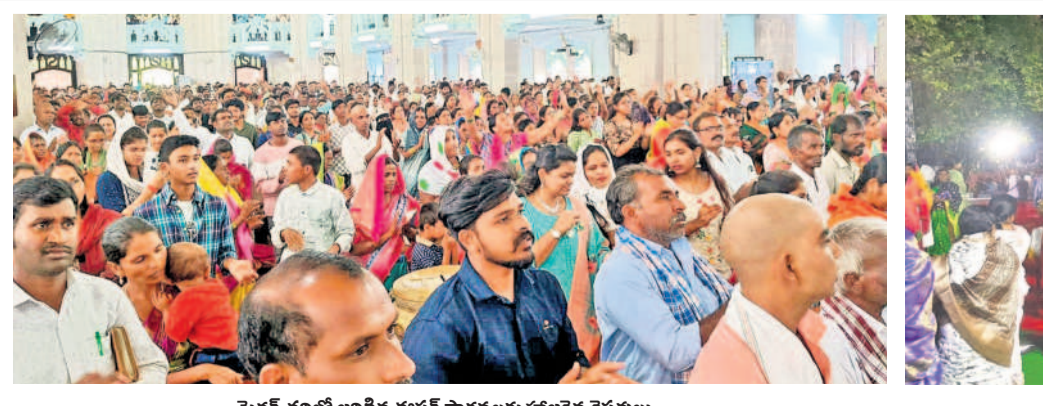
మెడక్ చర్చిలో జరిగిన ఈసర్ ప్రార్థనలకు హాజరైన శ్రేస్తపులు

మెడక్ మున్సిపాలిటీ/ చిలిపిచెడ్డ/ నర్సాపూర్/ చేగుంట, మార్చి 31: ఈసర్ పండుగ పురస్కరించుకున్న ప్రపంచ ప్రఖ్యాతిగాంచిన మెడక్ మహా దేవాలయంలో (చర్చి) ఆదివారం తెల్లవారు జామున నుంచి ఈసర్ వేడుకలు కనులపండుకగా నిర్వహించబడుతున్నాయి. గడే ప్రై డే రోజు అనుబంధం అనుబంధం యేనయ్య ప్రభుత్వం మూడో ఈసర్ సమాధి నుంచి భక్తులకు దర్శనమిస్తారు. కాళ్లు, చేతులకు కట్టిన మేకుల గాయాలను చూసి గుర్రెగి యేనయ్య లేచి వచ్చాడని అనందోత్సాహంతో భక్తులు ఉప్పొంగిపోతారు. దీన్ని శ్రేస్తపు లు ఈసర్ (పునరుత్థాన పండుగ)గా జరుపుకొంటారు. ఈసర్ ను పురస్కరించుకున్న నలు మూలల నుంచి, ఆంధ్ర, కర్ణాటక రాష్ట్రాల నుంచి వందలాది మంది భక్తులు తరలివచ్చారు. వేదాల మంది భక్తులతో మెడక్ మహా దేవాలయం కిటికీలాడింది. నిలువ ఉర్రేగింపుతో ప్రారంభమై మెడక్ చర్చి ప్రసిడెంట్ ఇన్ చార్జి రెవరెండ్ శాంతయ్య అధ్యక్షులలో ఉదయం నాలుగున్న