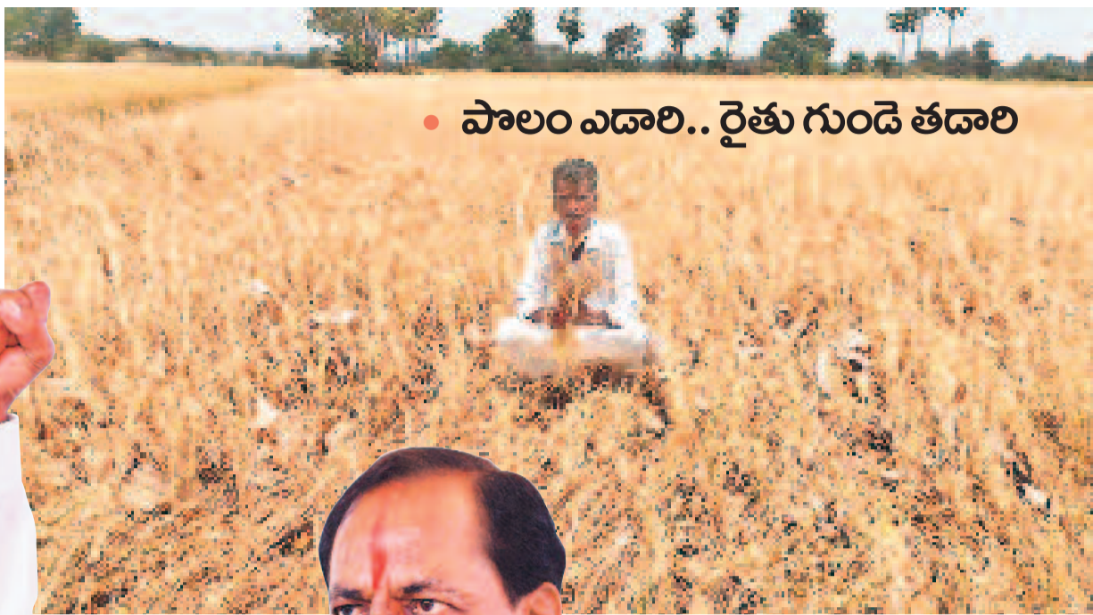
• పాలం ఎడారి.. రైతు గుండె తడారి