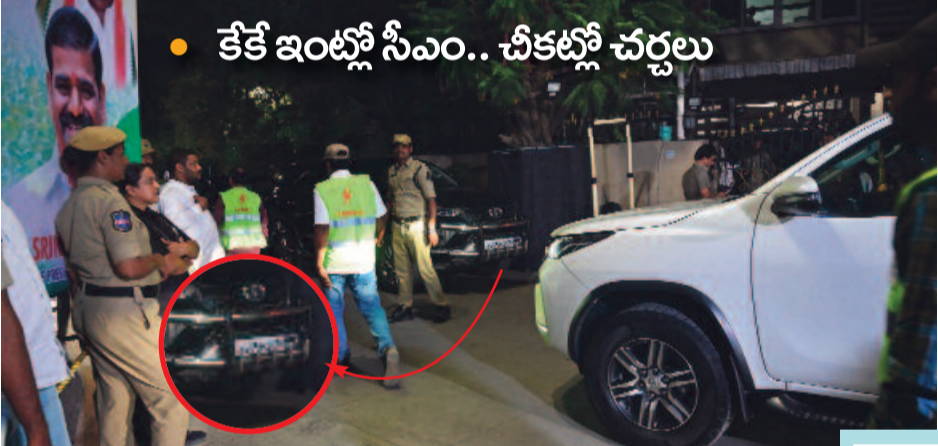
కాంగ్రెస్లో చేరేందుకు సిద్ధమైన రాజ్యసభ సభ్యుడు కే కేశవరావు ఇంటికి సీఎం రేవంత్ రెడ్డి కనివారం సాయంత్రం వెళ్లిన సమయంలో కరెంట్ పోయిన దృశ్యమిది. రాష్ట్రంలో కరెంట్ కోతలు అధికం. ప్రజలకు అంతరాయం లేకుండా విద్యుత్తు అందించాలని అధికారులతో ఉన్న తన్మయి సమీక్షలో సీఎం రేవంత్ రెడ్డి ఆదేశించిన కొన్ని గంటల్లోనే ఆయన కే విద్యుత్ కోత ఎదురుకావడం గమనార్హం. కేకతో సీఎం చీకట్లోనే చర్చలు సాగిస్తుండగా.. కరెంట్ మళ్లీ పునరుద్ధరణచేసేందుకు వచ్చిన టీఎన్ఎస్ డీసీఎల్ సిబ్బందిని చిత్రంలో చూడవచ్చు: (ఇన్ఫోలో) కేక నివాసంలో సీఎం రేవంత్ కారు

అడుగంటిన భూగర్భజలాలు... నోళ్లు తెరిచిన జలవనరులు 20 లక్షల ఎకరాల్లో పంట నష్టం మరో నెలలో 10 లక్షల ఎకరాల్లో.. ఎకరానికి 25వేల పెట్టుబడి నష్టం అప్పులపాలవుతున్న అన్నదాతలు కడుపు మండి పంటకు నిప్పు.. లేదంటే పశువులకు మేత సాగు నీళ్లు చేతులెత్తేసిన కాంగ్రెస్ కన్నెత్తి చూడని మంత్రులు