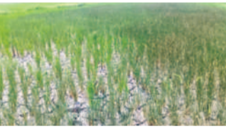
జడ్పీ మండలం మల్లిబోయిపల్లి గ్రామం సమీపంలో నెలెలుబారిన వరి పొలం