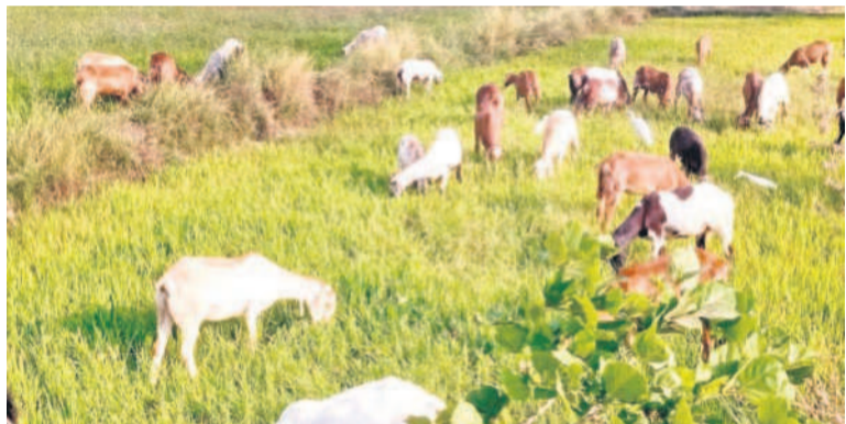
ఎండిన వరి పంటను మేస్తున్న పశువులు, గొర్రెలు