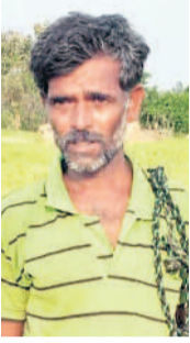
అడిగంట సాయిలు, రైతు, మొక్కదాడ

మా సొంత పొలంలో మూడెకరాల వరి, నాలుగెకరాలలో ఇతర పంటలు సాగు చేసినం. బోర్లలో మొదట్లో నీరు బాగానే వచ్చింది. రానురాను నీరు తగ్గి రోజుకో బండం చొప్పున వరి పంట నెలెలు పారుతుంటు వచ్చింది. రెండు మాడు కొత్త బోర్లు వేసినా నీళ్లు వడలేదు. ఏడెకరాల పంట కండ్లముడి ఎండిపోతుంటే చూడలేక పశువులను మేపుతున్నం. ఎండిన పంటకు ప్రభుత్వం పరిహారం అందించే ఆదుకోవాలి.