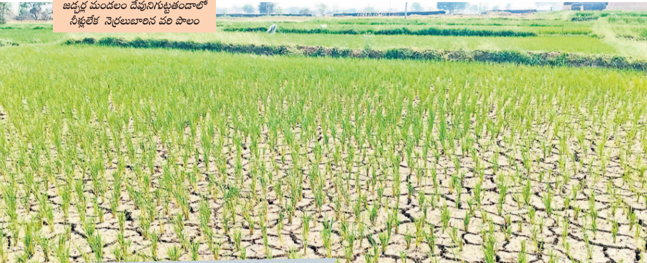
జడ్పీ మండలం దేవునిగుట్టతండాలో నీళ్లులేక నెలెలుబారిన వరి పొలం