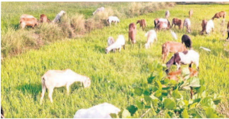
ఎండిన పరి పంటను మేస్తున్న పశువులు, గొర్రెలు

ఎందుకున్న పంటలను చూసి రైతులు గత్యం తరం లేక తమ పశువులను పొలాల్లో మేపుతున్నారు. మరికొందరు పంటను ముందుగానే కోసి పశు