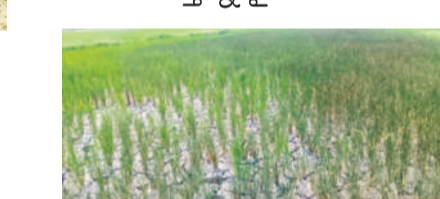
జడ్పర్ల మండలం మల్లెబోయిన్ పల్లి గ్రామం సమీపంలో నెలెలుబారిన వరి పొలం