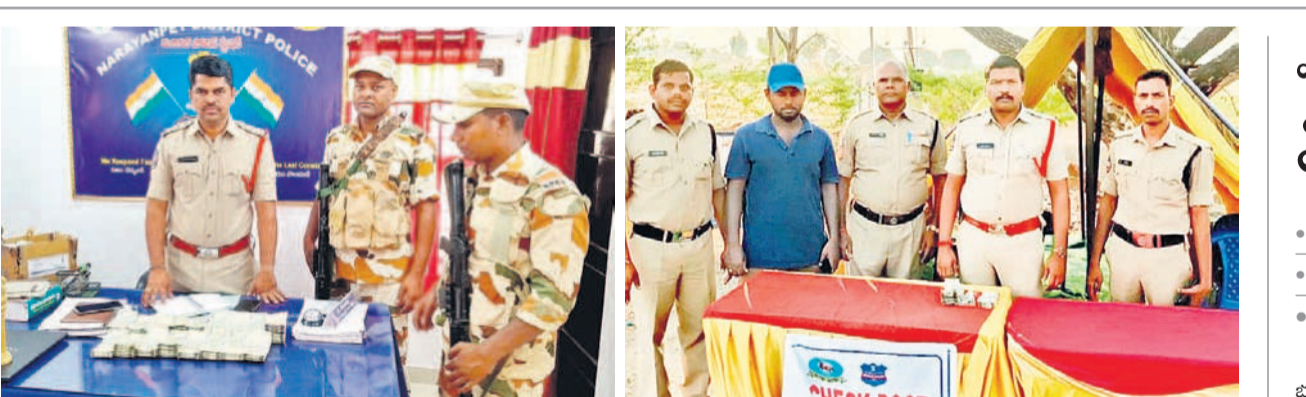
మరికల్లో పట్టుబడిన నగదును పుతన్న సీబి రాజేందర్ రెడ్డి, అడ్డాలకు బోలీగట్ వద్ద పట్టుబడిన నగదుతో ఎస్పీ తీసివేసారు