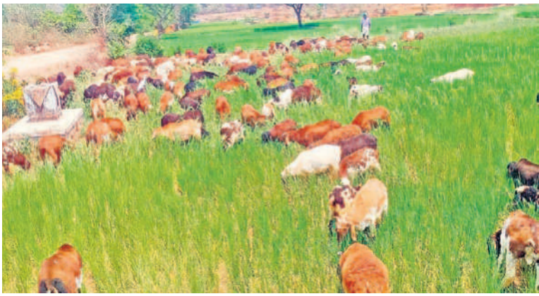
కొలిమికుచ్చతండాన మీపంలో ఎండిన పరి పంటను గొర్రెలకు పదిలేసిన రైతులు