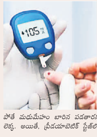
పోతే మధుమేహం బారిన పడతారని లెక్క. అయితే, ప్రీడయాబెటిక్ స్థితిలో

షుగర్ ముప్పును పక్కాగా గుర్తించు! వన్ అవర్-షాన్స్ గ్లూకోజ్ పరీక్షతో నిర్ధారణ