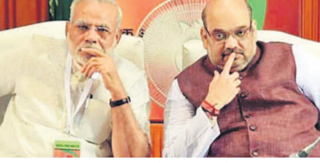
జైన్ శాఖ అనుమతినిచ్చింది. సత్యేందర్ జైన్ పై విచారణ కోసం సీబీఐ వంతు ప్రతిపాదనను ఫిబ్రవరిలో కేంద్ర హోంశాఖకు ఢిల్లీ లెఫ్టినెంట్ గవర్నర్ వీకే సత్యేనా పంపించగా శుక్రవారం అంగీకరించింది.

జైన్ శాఖ అనుమతినిచ్చింది. సత్యేందర్ జైన్ పై విచారణ కోసం సీబీఐ వంతు ప్రతిపాదనను ఫిబ్రవరిలో కేంద్ర హోంశాఖకు ఢిల్లీ లెఫ్టినెంట్ గవర్నర్ వీకే సత్యేనా పంపించగా శుక్రవారం అంగీకరించింది. సత్యేందర్ జైన్ పై విచారణ కోసం సీబీఐ వంతు ప్రతిపాదనను ఫిబ్రవరిలో కేంద్ర హోంశాఖకు ఢిల్లీ లెఫ్టినెంట్ గవర్నర్ వీకే సత్యేనా పంపించగా శుక్రవారం అంగీకరించింది.