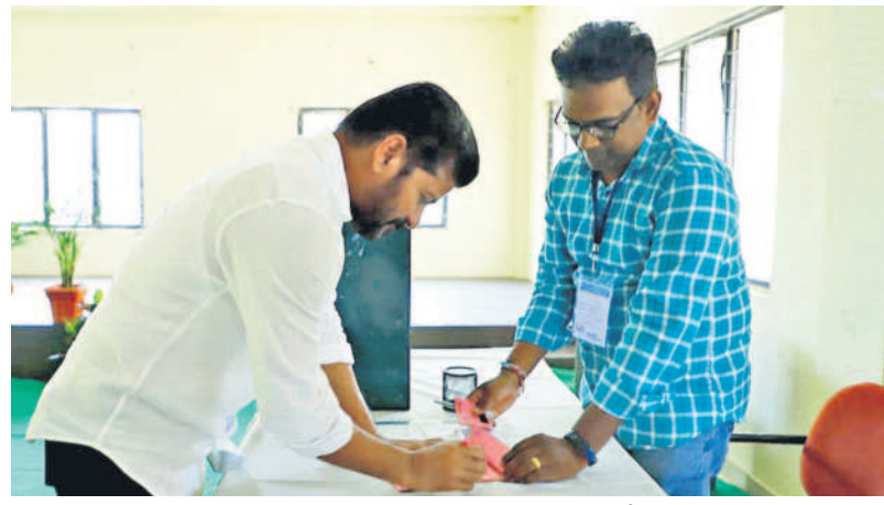
కొడంగల్లోని పోలింగ్ కేంద్రంలో ఓటు వేసేందుకు వచ్చిన సీఎం రేవంత్ రెడ్డి..