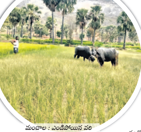
మంచాల : ఎండిపోయిన వరి పంటను పశువులకు మేపుతున్న రైతు

మంచాల మండలంలో 90 శాతం మేర వరిపంట ఎండిపోయింది. కండ్ల ముందే పంట ఎండిపోతుండడంతో ఎల్లప్పుడుదా, బోడికొండ తదితర గ్రామాల్లోని అన్నదాతలు పంటను కాపాడుకునేందుకు నానాతంటాలు వదుతున్నారు. అందుకోసం ట్యాంకర్ల ద్వారా నీటిని పారోపుతున్నారు. దీంతో ఇది అదునుగా భావించిన కొందరు వ్యాపారులు ఒక్కో ట్యాంకర్ కు రూ.1500 నుంచి రూ. 2000 వరకు వసూలు చేస్తున్నారు. అత్యధికంగా స్టామెంట్ లోని రైతులు తమ పంటను పశువులు, గోరైలు మాత్రం వదులుతున్నారు. ఏటా యాసంగి నీజన్ లో మండలంలోని పలు గ్రామాల్లో 7500 ఎకరాలకు పైగా వరి పంటను సాగు చేస్తున్నారు. ఈ సారి మాత్రం కేవలం 4000 ఎకరాలే సాగుచేశారు. మండలంలో బోరుబావులు తప్పక కాల్వలు లాంటి మరే ఇతర నీటి వనరులేలేదు. మండలంలో గతంలో ఇదవం అడుగుల లోతుకు బోరు వేస్తే కచ్చితంగా నీళ్లు వచ్చేవి. కానీ.. ఆరిందిన స్థాయిలో వర్షాలు కురువకపోవడంతో అన్నదాతలు ఆవేదన వ్యక్తం చేస్తున్నారు. కొంతమంది రైతులు పంటను కాపాడుకునేందుకు ట్యాంకర్ల ద్వారా నీటిని ఆందుతున్నారు. అట్టవచ్చేటంతా నీటి మండలంలోని మూసీ పరిసరాల్లో ప్రాంతం మినహా మిగతా ప్రాంతాల్లో పంటపొలాలు ఎందుతుండడంతో అన్నదాతలు ఆవేదన వ్యక్తం చేస్తున్నారు.