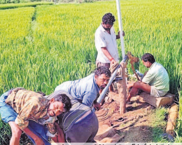
మంచాల : కాళిపోయిన మోటార్ ను తీస్తున్న రైతులు