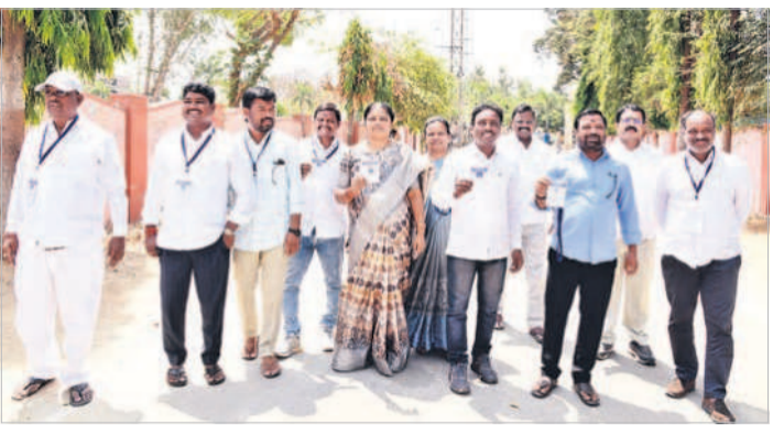
ఓటు వేసేందుకు వస్తున్న మహబూబ్ నగర్ కు చెందిన కొన్ని ఉద్ద