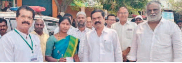
ఓటింగ్ అనంతరం మాజీ ఎమ్మెల్యేలతో ఎంపీటీసీలు

ఊట్కూర్/ముక్తల్ టౌన్/నర్స, మార్చి 28 : మండల జెడ్పీటీసీ సభ్యుడితో పాటు 16 మంది ఎంపీటీసీ సభ్యులు జిల్లా కేంద్రంలో గురువారం నిర్వహించిన ఎమ్మెల్యేల ఓటింగ్ లో పాల్గొని తమ ఓటు హక్కును వినియోగించుకున్నారు.