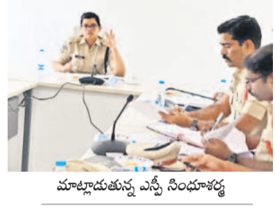
మాట్లాడుతున్న ఎస్సీ సింధూశర్