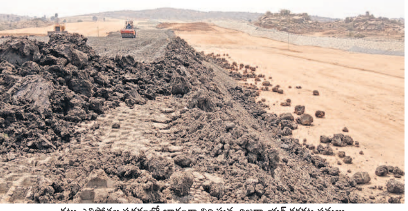
గట్టు ఎత్తిపోతల పథకంలో భాగంగా నిర్మిస్తున్న రిజర్వాయర్ కరకట్ట పనులు

కొలి ముఖ్యమంత్రి కేసీఆర్ ప్రాజెక్టు పనులను ప్రారంభించారు. అయితే ఈ పనులు ప్రస్తుతం నత్తేనడకన సాగుతుండడంతో మరో రెండు సంవత్సరాలైనా పనులు పూర్తయ్యే అవకాశం కనిపించడం లేదు. తుమ్మల చెరువు సమీపంలో ర్యాలం పాడు రిజర్వాయర్ నుంచి నీటిని తీసుకొని గట్టు మండలం రాయపురం సమీపంలో గట్టులమ్మ గట్టు వద్ద 1.320 టీఎంసీల సామర్థ్యంతో రిజర్వాయర్ నిర్మాణాన్ని చేపట్టే దీని ద్వారా గట్టు, కేటీడోడ్డి మండలాల్లోని 93వేల ఎకరాలకు సాగునీరు అందించడంతోపాటు ఈ మండలాల్లో 44 చెరువులతోపాటు కుంటలను నీటితో నింపి డిస్ట్రిబ్యూట్ చేసే ద్వారా పొలాలకు సాగునీటిని అందించడానికి దీనిని నిర్మించారు. నెల్లూపాడు ద్వారా నీరు అందజేసిన గట్టు, కేటీడోడ్డిలోని అన్ని గ్రామాలకు గట్టు ఎత్తిపోతల పథకం ద్వారా సాగునీరు అందించి ప్రాంతాలను సమృద్ధి చేయడానికి కేసీఆర్ ప్రభుత్వం ప్రయత్నిస్తున్న కాంగ్రెస్ ప్రభుత్వం అధికారంలోకి రాగానే పనులు పడకేనా చేసేంది. ఎత్తిపోతల స్వరూపం ఇది.. ర్యాలంపాడు రిజర్వాయర్ నుంచి అప్రోచ్ కెనాల్ ద్వారా మూడు కిలోమీటర్ల దూరంలో ఏర్పాటు చేసిన పంపిణీకాన్సెప్ట్ నీటిని పంపిస్తారు. పంపిణీకాన్సెప్ట్ నుంచి 12మెగావాట్ల (ఎండబూట్ల) సామర్థ్యం కలిగిన రెండు మార్లర్ల ద్వారా మూడు మీటర్ల వ్యాసం కలిగిన టెన్షన్లనుంచి మూడు కిలోమీటర్ల దూరంలోని గట్టులమ్మ గట్టు రిజర్వాయర్లోకి నీటిని తోడిపోస్తారు. 50రోజుల పాటు ర్యాలంపాడు రిజర్వాయర్ నుంచి గట్టు ఎత్తిపోతల పథకానికి నీటిని ఎత్తిపోయనున్నారు. రిజర్వాయర్