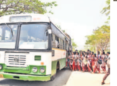
తెలంగాణ ప్రభుత్వం కేంద్రాల్లో బంధించింది. మహబూబ్ నగర్, మార్చి 27

పుట్టి బోర్డు ప్రయాణం ప్రమాదకరమని తెలిసినా తప్పని పరిస్థితుల్లో విద్యార్థులు వేలాడుతూ వెళ్తున్నారు. ప్రయాణికులకు మెరుగైన సౌకర్యాలు కల్పిస్తున్నామని గొప్పలు చెబుతున్న ఆర్టీసీ సంస్థ గ్రామీణ ప్రాంతాలకు సలగా బస్సులు నడిపించకపోవడంతో విద్యార్థులు పుట్టిబోర్డు వేలాడుతూ వెళ్తున్న దుస్థితి నెలకొంది. మహబూబ్ నగర్ నుంచి ఖిల్లాపూరు వరకు ముగ్గురు వ్యక్తులు వెళ్తున్న కిక్కిరిసి రావడంతో దౌంతుకుంట్ల వద్ద దాదాపు 10 మంది విద్యార్థులు బస్సు పుట్టిబోర్డు వద్ద వేలాడుతూ ప్రమాదకరంగా ప్రయాణించడం 'సమస్య'