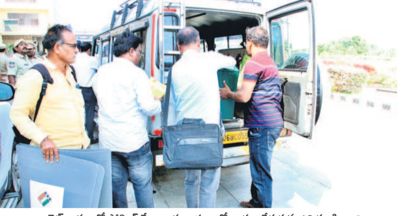
బ్యాలెట్ బాక్సులతో పోలింగ్ కేంద్రాలకు వాహనాల్లో బయలుదేరుతున్న ఎన్నికల సిబ్బంది