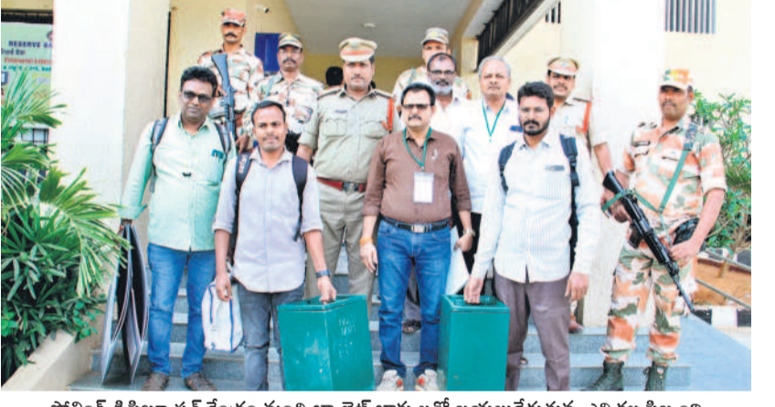
పోలింగ్ డిస్ట్రిబ్యూషన్ కేంద్రం నుంచి బ్యాలెట్ బాక్సులతో బయలుదేరుతున్న ఎన్నికల సిబ్బంది

బాక్సులతోపాటు సిబ్బందిని బందోబస్తు మధ్య తరలించారు. పోలింగ్ ప్రక్రియ అంతా నిమగ్నం చేసుకొని పోలింగ్ కేంద్రాలకు వెళ్తున్నారని తెలిపారు. మహబూబ్ నగర్ జిల్లా కేంద్రంలోని బాలల కళాశాలలో ఏప్రిల్ 2న కౌంటింగ్ ఏర్పాటు చేస్తున్నారు. బ్యాలెట్ బాక్సులు భద్రపరిచే స్టాఫ్ రూంలో పాటు ఓట్ల లెక్కింపునకు ప్రత్యేక ఏర్పాట్లు చేశారు.