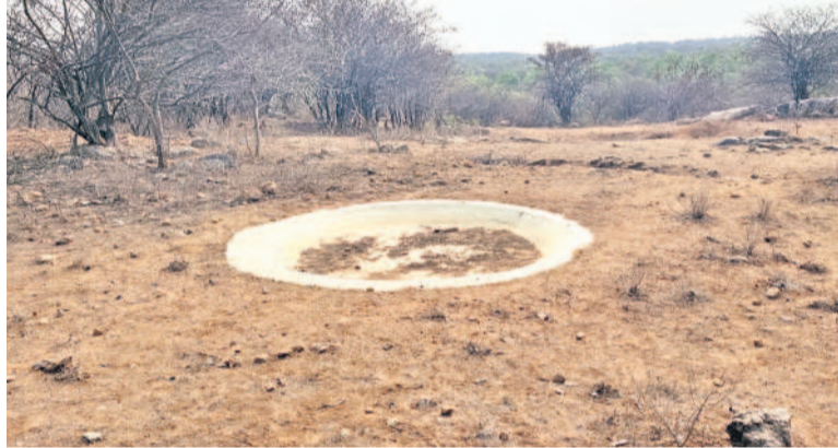
ముమ్మాయిపల్లి పార్కులో నీరులేక చెత్తతో నిండిపోయిన సానరీ

బిజినెస్ పర్సన్, మార్చి 27 : నాగర్ కర్నూల్ రేంజ్ పరిధిలోని బిజినెస్ పరిశ్రమల ముమ్మాయిపల్లి, గంగారం, లట్టపల్లి గ్రామాలకు కలుపుకొని వేల ఎకరాలలో అడవి విస్తరించి ఉన్నది. ఈ అడవిలో ఎన్నోరకాల జంతువులు జీవిస్తున్నాయి. వేసవిలో తాగడానికి నీరులేక సమీప పొలాల్లోకి వెళ్లి దాహం తీర్చుకుంటున్నాయి. గతంలో అటవీశాఖాధికారులు దాహం 23 ప్రాంతాల్లో జంతువులకు నీటిని అందించేందుకు సానరీపిట్లను నిర్మించారు. వాటిని నీటితో నింపకపోవడంతో చెత్తాచెదారంతో దర్భను విస్తున్నాయి. వేల ఎకరాల విస్తీర్ణంలో ఉన్న ఈ అడవిలో ఎన్నో రకాల పండ్లను ఇచ్చే మొక్కలు ఉన్నాయి. కేసీఆర్ సర్కారు హయాంలో మొక్కలను పెంచేందుకు ప్రాజెక్టు ఏర్పాటు చేసి రకరకాల మొక్కలను నాటారు. ఓటితోపాటు ఫారెస్టులో ఉన్న రహదారి పొడవునా మొక్కలను నాటారు.