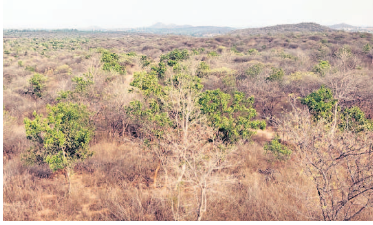
బిజినెస్ పరిశ్రమలలోని ముమ్మాయిపల్లి పార్కు