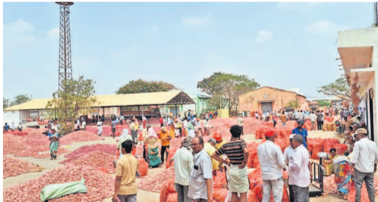
దేవరకర్ణ మార్కెట్ లో విక్రయానికి ఉంచిన ఉల్లి

దేవరకర్ణ, మార్చి 27 : దేవరకర్ణ మార్కెట్ కు రైతులు ఉల్లిగడ్డను బుధవారం అమ్మకంగా తీసుకొచ్చారు. గతదాని దిగుబడి లేక రూ.3వేల మార్కెట్ దాటిన ఉల్లి ధరలు ఈ ఏడాది దిగుబడులు పెరగడంతో సగం ధరకు పడిపోయాయి. కాలి, రవాణా, పెట్టుబడి పోనూ రైతులకు నష్టాలు ఎదురవుతున్నాయి. దాదాపు 10వేల క్వింటాళ్లకు పైగా ఉల్లి విక్రయానికి వచ్చినట్లు మార్కెట్ కమిటీ సభ్యులు తెలిపారు. క్వింటాల్ గరిష్టంగా రూ.1,400 ధర పలుకగా, కరిష్టంగా రూ.900 ధరకు పలికింది. గత వారంతో పోల్చితే రూ.100 ధర తగ్గింది.