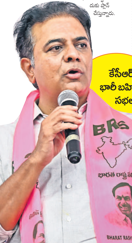
కేసీఆర్ తో భారీ బహిరంగ సభలు

లను నెరవేర్చకపోవడం.. అన్ని వర్గాల సంక్షేమాన్ని సైతం విస్మరించడం వంటి అంశాలను ప్రజల్లోకి తీసుకువెళ్లి బీఆర్ఎస్ అభ్యర్థుల గెలుపు లక్ష్యంగా పార్టీ శ్రేణులు కృషి చేస్తోంది.