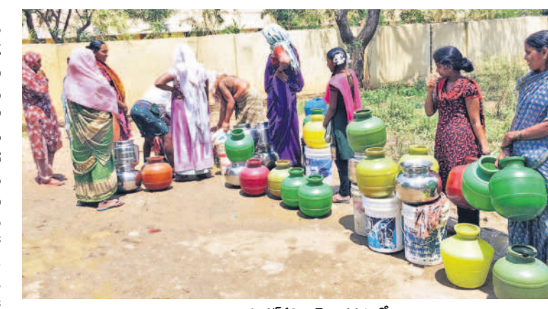
కూకట్పల్లి నియోజకవర్గంలో తాగునీటి కోసం బందెలతో క్యూలో నిలబడిన మహిళలు (ఫైల్)

సీటీబియార్, మార్చి 27 (సమస్తీ తెలంగాణ) : పదేండ్ల తర్వాత గ్రేటర్ వాసులు గుక్కడు నీటికోసం అల్లాడిపోతున్నారు. కేసీఆర్ హయాంలో.. పదేండ్ల కాలంలో ఏ రోజూ రూపి నీటి సమస్య.. కాంగ్రెస్ ప్రభుత్వం పక్కా చేపట్టిన మూడు నెలల్లోనే కరువు కోరలు చాస్తున్నది. మళ్లీ ఖాళీ బిందెలు చేతపట్టి రోడ్లు ఎక్కాలివ్వడం పరిస్థితి వచ్చింది. కండ్లముందు నీటి కష్టాలు కనిపిస్తున్నా జలమందలి అధికారులు ప్రత్యామ్నాయ చర్యలు తీసుకోకపోవడంపై ప్రజలు ఆగ్రహం వ్యక్తం చేస్తున్నారు.