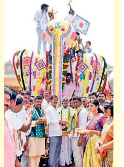
ఏనుగు వాహనంపై ఊరేగింపు