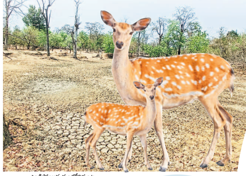
ఎండిపోయిన గుంటలోని కుంటలు