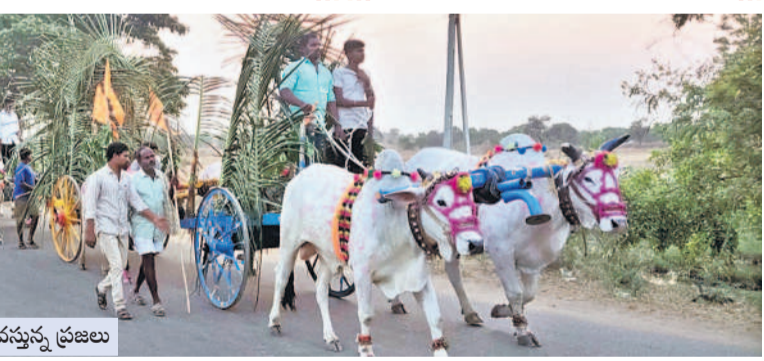
ఎడ్ల బండ్లపై ఊరేగింపుగా వస్తున్న ప్రజలు