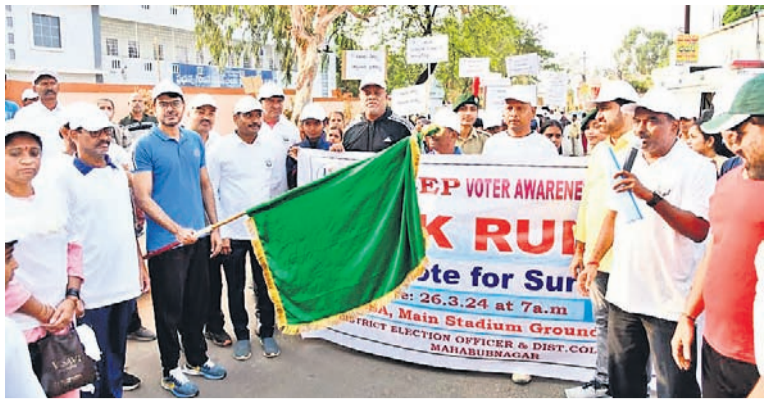
ఓటరు చైతన్య రా్యలీని ప్రారంభిస్తున్న అదనపు కలెక్టర్ వేంద్రప్రతాప