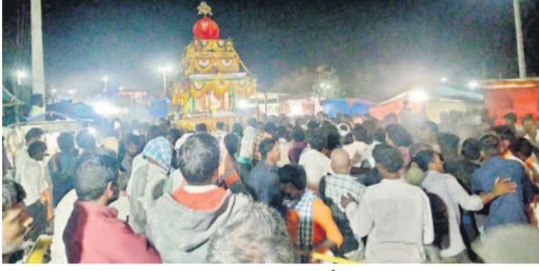
తిరుమలనాథుడి రథాన్ని లాగేందుకు పోటీ పడుతున్న భక్తులు