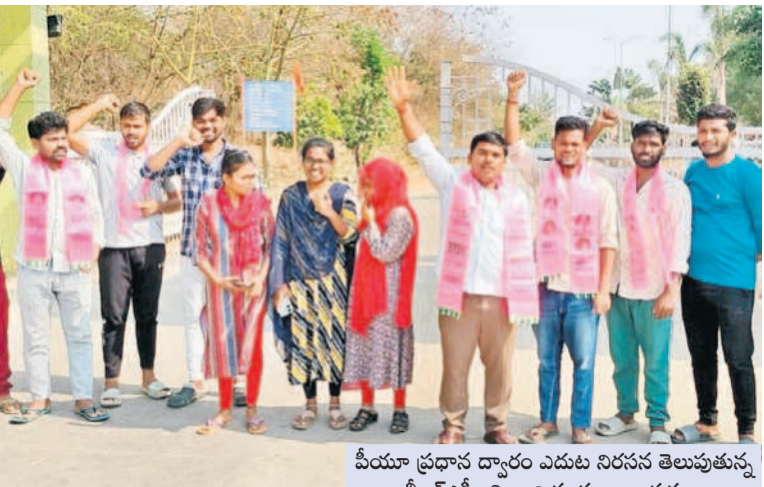
పీయూ ప్రధాన ద్వారం ఎదుట నిరసన తెలుపుతున్న బీఆర్ఎస్ వినూత్ని సంఘం నాయకులు