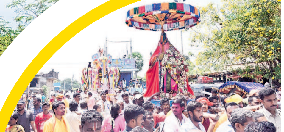
స్వామివారికి పల్లకి సేవ