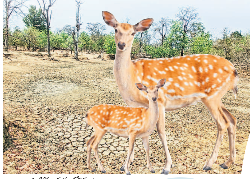
ఎండిపోయిన గుంటలోని కుంట