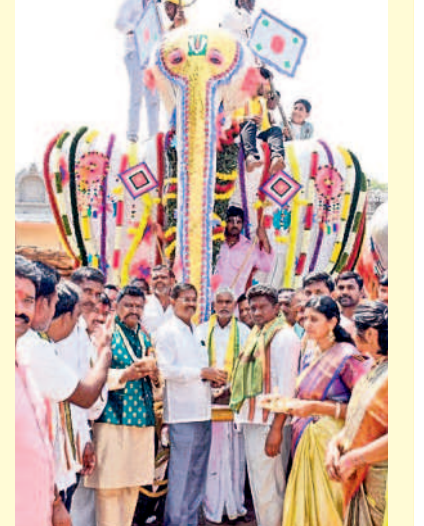
ఏనుగు వాహనంపై ఊరేగింపు