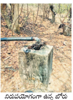
నిడువయోగంగా ఉన్న బోరు