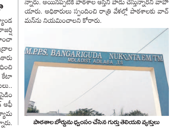
పాఠశాల బోర్డును ధ్వంసం చేసిన గుర్తు తెలియని వ్యక్తులు

ఆదిలాబాద్ రూరల్, మార్చి 26 : ఆదిలాబాద్ మండలంలోని బంగారుగూడ మండల పరిషత్ ప్రాథమిక పాఠశాలలో గర్భు తెలియని వ్యక్తులు సామగ్రిని ధ్వంసం చేశారు. సోమవారం రాత్రి పాఠశాల ఆవరణలోని ఇనుపు పైపులతోపాటు కూర్చోనే గడ్డను పగుల గొట్టారు. ఈ విషయమై ప్రధానోపాధ్యాయుడు ఆరోగ్య మట్లాడుతూ.. గతంలో కూడా సామగ్రిని గుర్తు తెలియని వ్యక్తులు ధ్వంసం చేశారని, పోలీసులకు ఫిర్యాదు చేసిట్లు వేర్కొన్నాయి. అయినప్పటికీ పాఠశాల ఆస్తిని పాడు చేస్తున్నారని వాపోయాడు. అధికారులు స్పందించి రాత్రి వెళ్లలో పాఠశాలకు వాచ్ మన్ ను నియమించాలని కోరారు.