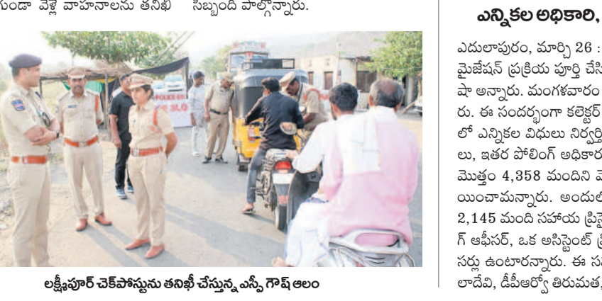
లక్ష్మీపూర్ చెక్ పోస్టును తనిఖీ చేస్తున్న ఎన్సీ గౌడ్ లెం

తాసి (తలపడుగు), మార్చి 26 : పార్లమెంట్ ఎన్నికల నేపథ్యంలో అంతర్ జిల్లాల సరిహద్దు వెక్ పోస్టుల వద్ద అధికారులు, సిబ్బంది అప్రమత్తంగా ఉండాలని ఎన్సీ గౌడ్ సిబ్బంది సమన్వయంతో విడుదల నిర్వహించాలని సూచించారు. తలపడుగు మండలం లోని పిప్పల్ గావ్ పాతా వెక్ పోస్టును పరిశీలించి పిప్పల్ గావ్ పాతా వెక్ పోస్టును పరిశీలించారు. ఈ సందర్భంగా ఎన్సీ గౌడ్ పాతా వెక్ పోస్టును పరిశీలించారు. ఈ సందర్భంగా ఎన్సీ గౌడ్ పాతా వెక్ పోస్టును పరిశీలించారు.