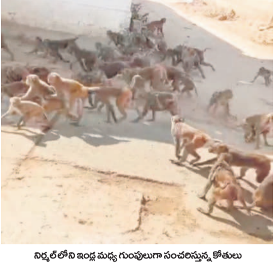
నిర్వల్ లోని ఇండ్ర మధ్య గుంపులుగా సంచరిస్తున్న కోతులు

మంకీ రెస్క్యూ సింటర్ ను పట్టించుకోని పాలక వర్గాలు నిర్వల్, మార్చి 26 (నమస్తే తెలంగాణ) : నిర్వల్, ఖైరాపూర్, బానూపూర్ పట్టణాల తోపాటు గ్రామాల్లో కొంతమంది బీభత్సం సృష్టిస్తున్నాయి. జనం ఇండ్ల నుంచి బయటకు వెళ్లేడానికి జంకుతున్నారు. చేతిలో కర్ర లేకుండా వెళ్లేడం లేదు. ఒక వేళ కోతిని బెదిరిస్తే పడుల సంఖ్యలో కోతులు వచ్చి ఎదురుదాడి చేస్తున్నాయి. ప్రభుత్వ ప్రైవేటు ఆసుపత్రులకు రోజూ పడుల సంఖ్యలో గాయపడ్డవారు వస్తున్నట్లు వైద్యులు చెబుతున్నారు.