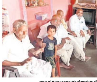
బాధిత కుటుంబాలను పరామర్శిస్తున్న మోక్షి మంత్రి