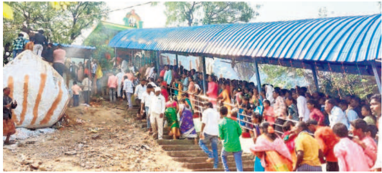
లింగమంతుల స్వామిని దర్శించుకునేందుకు బారులుబీసిన భక్తులు