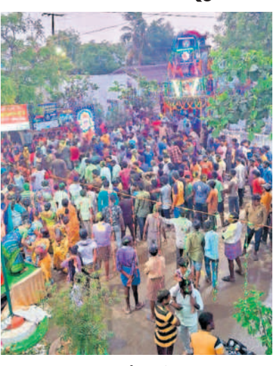
పిల్లలమర్రిలో చెన్నకేశవస్వామి రథోత్సవంలో పాల్గొన్న భక్తులు