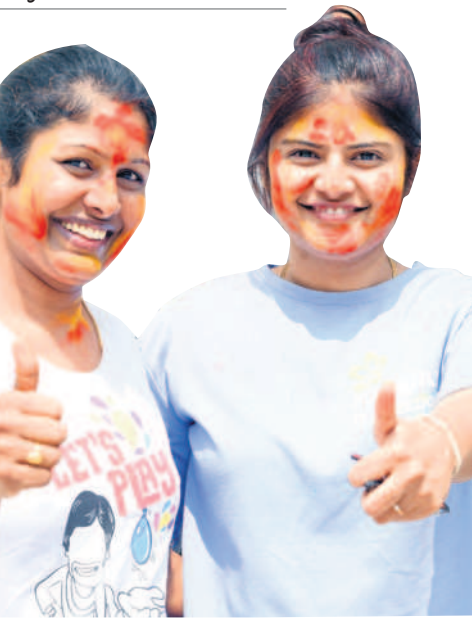
నల్లగొండ విద్యానగర్ లో హోలీ సంబురాలు

వసంత రుతువులో వచ్చే తొలి పండుగ హోలీ పండుగను జిల్లా వ్యాప్తంగా ఘనంగా జరుపుకొన్నారు. వాడవాడూ చిన్నా పెద్ద రంగులు పులుముకొని సంతోషంగా గడిపారు. డప్పుళ్లు, డీజే పాటలతో డ్యాన్స్ చేశారు. కేలింతలు కొడుతూ ర్యాబీలు తీశారు. చిన్నారులు ఎక్కడ చూసినా బాబీళ్లలో రంగులు నింపుకొని నీరంజీలు పట్టుకొని కలిపించారు. కాలనీలు, అపార్ట్ మెంట్ లలో సామూహిక వేడుకలతో పండుగ వాతావరణం నెలకొన్నది. పలుచోట్ల హోలీ వేడుకల్లో ప్రజాప్రతినిధులు, అధికారులు పాల్గొని అందరిలో ఉత్సాహం నింపారు.