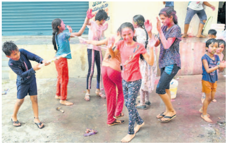
నల్లగొండలోని మీర్బాగ్ కాలనీలో హోలీ అడుతున్న చిన్నారులు