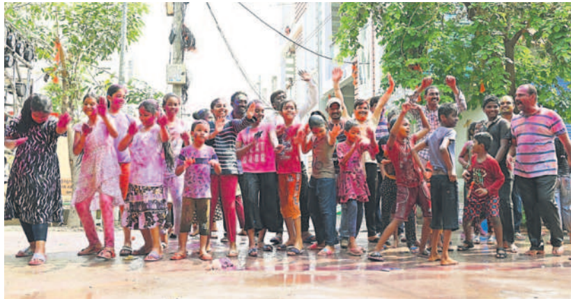
సూర్యాపేటలో హోలీ అడుతున్న చిన్నారులు, యువత