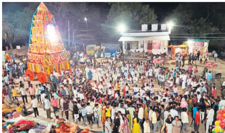
కందూరు రామలింగేశ్వరస్వామి రథాన్ని లాగేందుకు పోటీ పడుతున్న భక్తులు

రథంపై ఊరేగిన ఆది దంపతులు • తేరులాగేందుకు భక్తుల పోటీ • పంచాక్షరి మంత్రంతో మార్మోగిన కందూరు క్షేత్రం