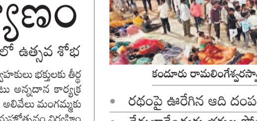
మహబూబ్ నగర్ లో..