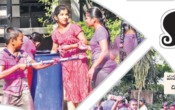
వనపర్తి జిల్లా కేంద్రంలో చిన్నారుల కేరింతలు