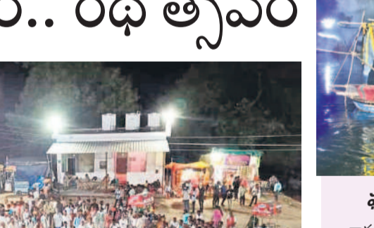
నారాయణపేటలో కూలిన వాటర్ ట్యాంక్, లక్ష్మీప్రణేత(పైట)

మామిడిపాదగ్రామంలో, మార్చి 25 : మండలంలోని మామిడిపా