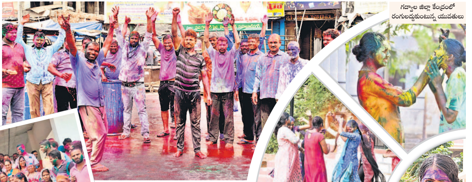
గద్వాల జిల్లా కేంద్రంలో రంగులద్దుకుంటున్న యువకులు

5 మహబూబ్ నగర్, మంగళవారం 26 మార్చి 2024 MAHABUBNAGAR NARAYANPET