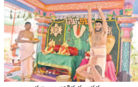
కల్యాణం జరిపిస్తున్న అర్చకులు