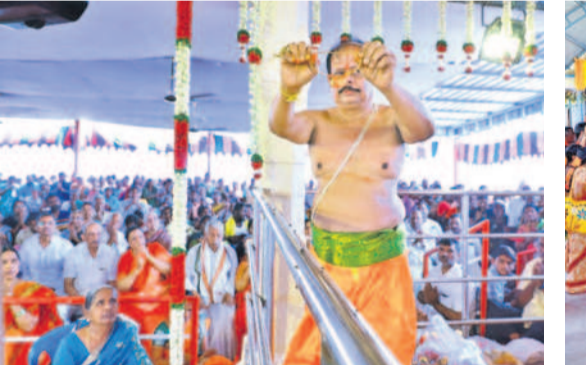
అలివేలు మంగమ్మ కల్యాణం సందర్భంగా తాళిబొట్టు చూపిస్తున్న అర్చకుడు, పల్లకీసేవలో పాల్గొన్న భక్తులు