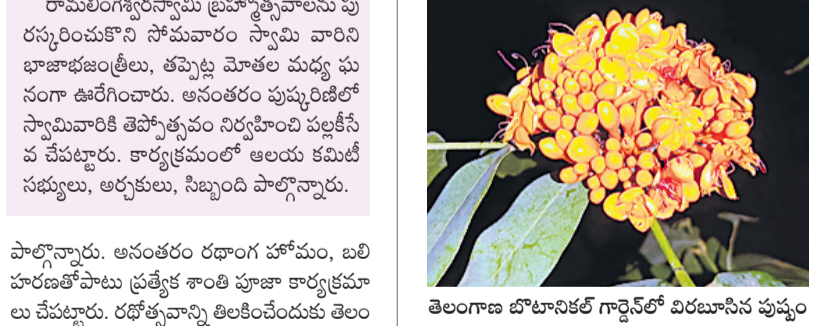
తెలంగాణ బోటానికల్ గార్డెన్ లో విరబూసిన పుష్పం

జడ్చర్లలో, మార్చి 25 : జడ్చర్లలోని ప్రభుత్వ డి గ్రీ కళాశాల తెలంగాణ బోటానికల్ గార్డెన్ లో అరుదైన సీతా అశోక మొక్క పుష్పం విరబూసింది. అంతరం విశాఖపట్టణ మొక్కలలో ఒకటిగా సీతా అశోక మొక్కలు తెలంగాణ రాష్ట్రంలో కేవలం నల్లమల అడవుల్లోనే పె రుగుతాయి. ఈ మొక్క ఆంధ్రప్రదేశ్ లోని యోగివే మన యూనివర్సిటీలోని టీడీ బోటానికల్ గార్డెన్ నుం చి నకరించి జడ్చర్లలోని తెలంగాణ బోటానికల్ గార్డెన్ లో పెంచుతున్నారు. ఈ క్రమంలో సీతా అశోక మొక్క అందమైన ఆకృతిలో పుష్పించింది గార్డెన్ సమ స్వయంకర్షణకరమైనదిగా తెలిపారు. ఈ మొ క్కు సరాక అశోక అనే శాస్త్రీయ నామం ఉన్నట్లు పే రొన్నారు. ఈ చెట్టులోని ప్రతిభాగం ఔషధమేనని, దీని నుంచి అసోకార్బన్ అనే మందును తయారు చే స్తారని చెబుతారు. మహిళలకు సంబంధించిన వ్యాధు లు నయం చేయడానికి దీన్ని ఉపయోగిస్తారన్నారు. పురాణాల్లోనూ ఈ మొక్క ప్రాధాన్యతను తెలియజే శారని, బుద్ధుడు అశోక చెట్టు కింద జన్మించాడని, అశోకచెట్టు వనంలో నన్నానం స్వీకరించాడని ప్రతీతి. ఈ చెట్టు ఎక్కడ ఉంటే అక్కడ శోకం ఉండదని చెబు తుంటారన్నారు. అంతరం విశాఖపట్టణ కౌ.కా.మొక్కలను కాపాడే క్రమంలో తెలంగాణ బోటానికల్ గార్డెన్ లో దీన్ని పెంచుతున్నట్లు సదాశివయ్య తెలిపారు.