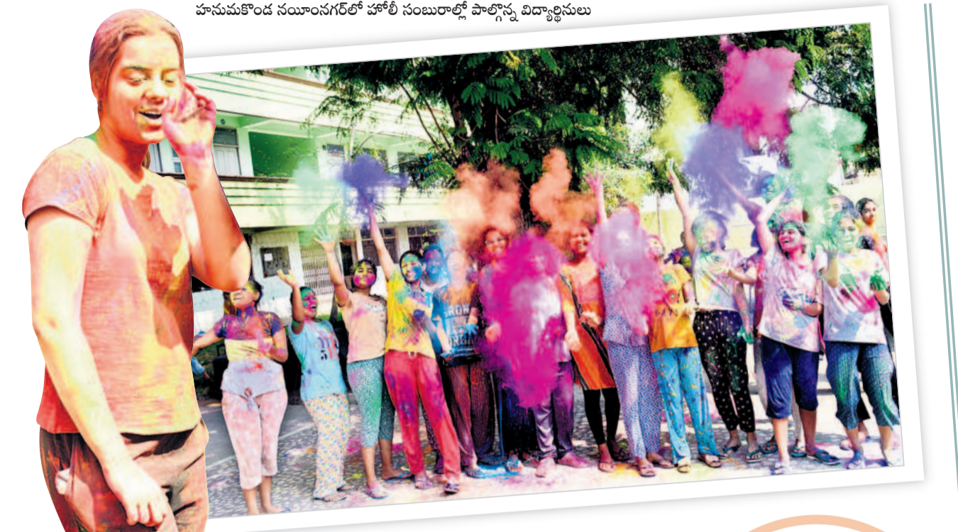
హనుమకొండ నయానగర్లో హోలీ సందేరాల్లో పాల్గొన్న విద్యార్థులు