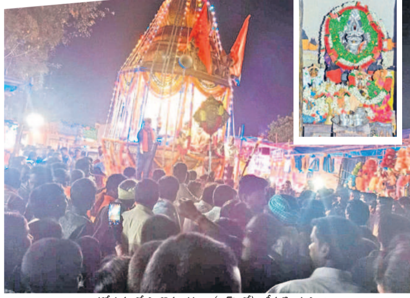
రథోత్సవంలో పాల్గొన్న భక్తులు, (ఇన్సీసీ) లక్ష్మీనరసింహస్వామి