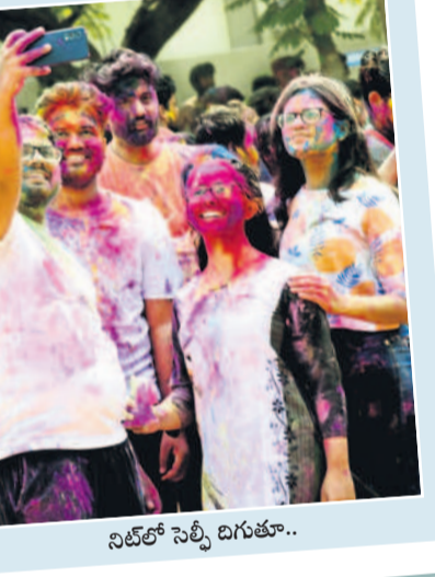
నిట్లో సెట్టి బగుతూ..