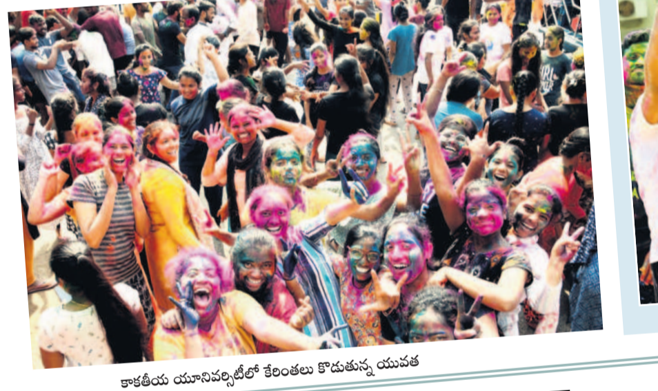
కాకతీయ యూనివర్సిటీలో కేలంతలు కొడుతున్న యువత