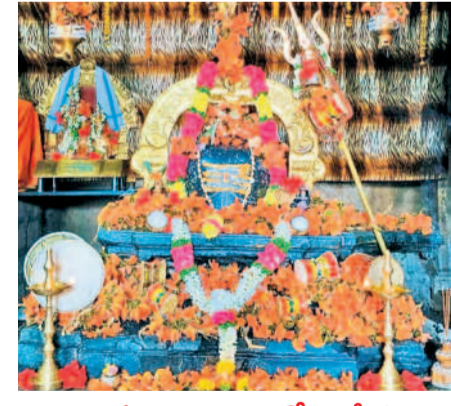
మోదుగుపూల అలంకరణలో గణపేశ్వరుడు

హనుమంట్, మార్చి 25 : ఎరగట్టుగుట్ట వేంకటేశ్వరస్వామి జాతర బ్రహ్మోత్సవాలు సోమవారం ఆంగారం వైభవంగా ప్రారంభమయ్యాయి. హనుమంట్, బీమారంలోని వేంకటేశ్వరస్వామి ఆలయాల నుంచి రథాలపై శ్రీదేవి, భూదేవి సమేత స్వామివారి ప్రతిమలను డప్పువచ్చుకోవడం ఆరగట్టు గుట్ట వేంకటేశ్వరస్వామి ఆలయానికి తీసుకొచ్చారు. రాత్రి 11.48 గంటలకు ఆర్యకులు వైభవంగా స్వామివారి కళ్యాణం నిర్వహించారు. అనంతరం జాతర ప్రారంభమైంది. ఈ జాతరకు వివిధ రాష్ట్రాల నుంచి భక్తులు తరలివచ్చి వేంకటేశ్వరస్వామిని దర్శించుకొని మొక్కులు చెల్లించుకుంటారు. అలాగా, వివిధ గ్రామాల నుంచి భక్తులు రాత్రి ఎడ్లబండ్లతో వచ్చి గుడుపట్టా తిరిగి స్వామివారిని దర్శించుకున్నారు. ఈ వేడుకలు ఐదు రోజులపాటు జరుగుతున్నాయి.