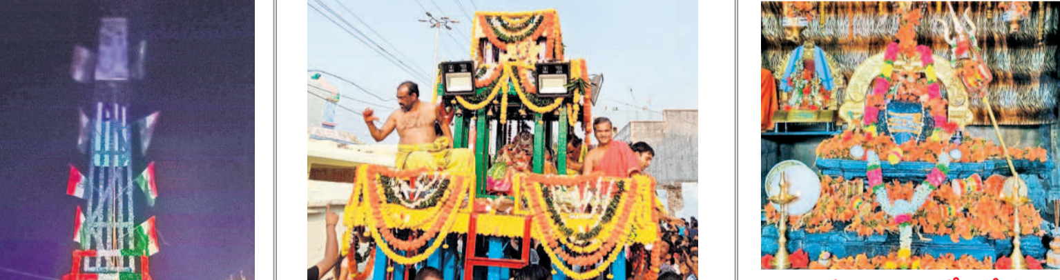
రథంపై వేంకటేశ్వరస్వామి, శ్రీదేవి, భూదేవి అమ్మవార్ల ప్రతిమలు తీసుకొస్తున్న ఆర్యకులు