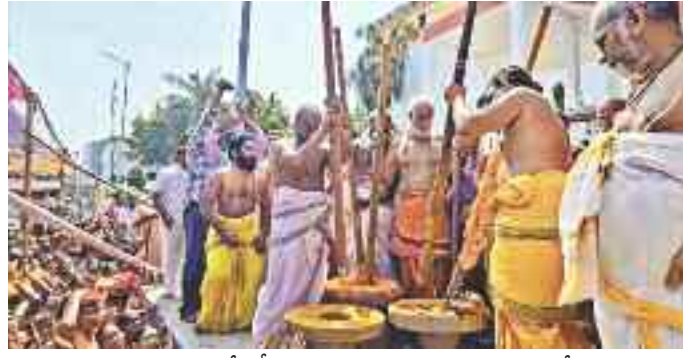
భద్రాచలంలోని సీతారామచంద్రస్వామి ఆలయ సన్నిధిలో పసుపు కొమ్ములు దంచుతున్న అర్చకులు