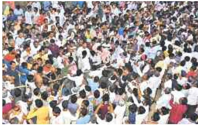
రెండు వర్గాలుగా విడిపోయి గుద్దుకుంటున్న గ్రామస్థులు

భద్రాచలం, మార్చి 25: హోలీ పర్వదినాన్ని పురస్కరించుకొని భద్రాచలం సీతారామచంద్రస్వామి దేవస్థానంలో సోమవారం నేత్రపర్వం, వసంతోత్సవాలను నేత్రపర్వంగా నిర్వహించారు. ఉత్సవమూర్తులకు పంచామృతాలతో ప్రత్యేక స్నానం చేపట్టారు. ఏప్రిల్ 17న శ్రీరామ నవమిని పురస్కరించుకొని స్వామివారి కల్యాణంలో వినియోగించే తలంబ్రాల తయారీకి సంప్రదాయ పద్ధతిగా శ్రీకారం చుట్టారు. వేదపండితుల మంత్రాల నడుమ అలంకరించిన బంగారు ఊయలలో స్వామివారిని ఆశీసులను చేసి