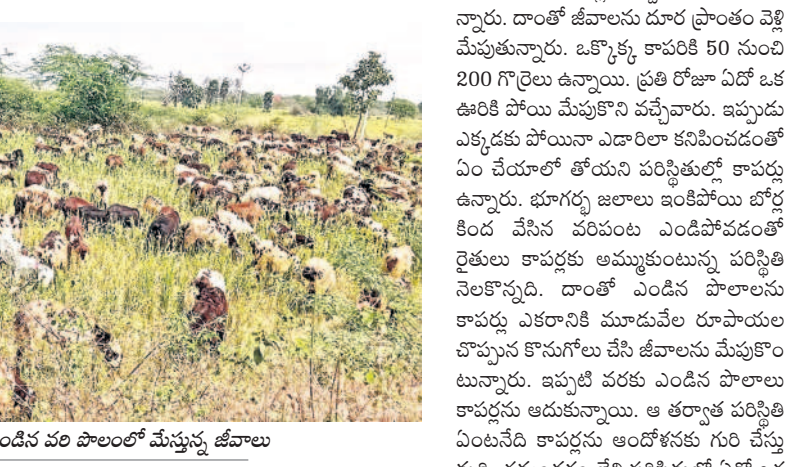
దామరచర్లలో ఎండిన వరి పొలాలలో మేస్తున్న జీవాలు

జీవాల పెంపకం కష్టంగా మారింది. ఇప్పటి వరకు మంచి డిమాండ్ ఉన్న గొర్రెలకు మేత లేక తక్కువ ధరకు అమ్ముకోవాల్సిన దుస్థితి ఏర్పడింది.