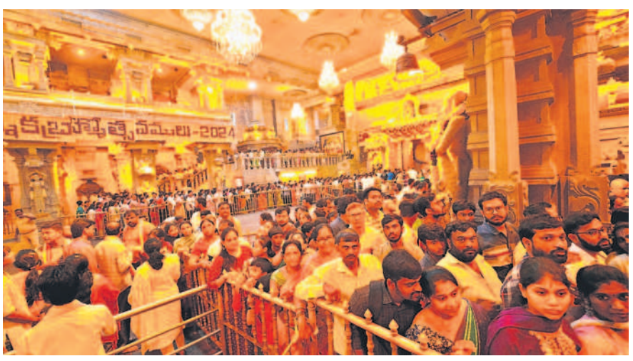
ఆలయంలో భక్తుల రద్దీ

యాదగిరిగట్టు, మార్చి 24 : యాదగిరిగట్టు లక్ష్మీ నర సింహ స్వామి క్షేత్రం ఆదివారం భక్తజన సంద్రంగా మారింది. సెలవుదినం కావడంతో స్వామివారిని దర్శించుకునేందుకు అధిక సంఖ్యలో వచ్చారు. మాధవీదేవి, కన్యాశ్రమి, ప్రసాద విక్రయాలు, లక్ష్మీ పుష్పరీతి, కల్యాణ కట్ట, సత్కారాలను ప్రత్యేకంగా భక్తులకే కేటగిరి లాగా ఉంది. కొండకింద పార్కింగ్ వాహనాలతో నిండిపోయింది. స్వామివారి ధర్మదర్శనానికి 9 గంటలు, ప్రత్యేక దర్శనానికి 2 గంటల సమయం పట్టింది భక్తులు వెళ్లడం చూడవచ్చు.