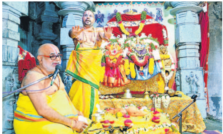
నిత్య కళ్యాణం నిర్వహిస్తున్న అర్చకులు