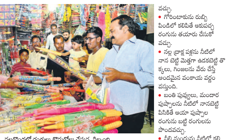
నల్లగొండలో రంగుల కొవ్వులు చూస్తున్న సిబ్బంది