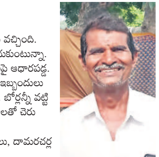
- పగడి కొండలు, దామరచర్ల

గత పదింట్లగా ఎన్నడూ రాని కరువు ఇప్పుడు వచ్చింది. నేను పచ్చనాయంతో పాటు 30 జీవాలను పెంపకుతున్నా. కరువు కారణంగా పంటలు ఎండిపోగా జీవాలు అధికంగా కాపర్లకు మేపుతూ గడిపాం. నెల రోజుల నుంచి 20 మంది రైతులు వదిలేసిన పొలాలను కొని జీవాలను మేపిన. ప్రస్తుతం అవికూడా లేకుండా పోయినాయి. ఏం చేయాలో అర్థం కావడం లేదు. చెరువుల్లో చుక్కచీరు లేదు. గట్టపై మేతలేదు. పరిస్థితి ఇలాగే ఉంటే జీవాలను అమ్ముకోవాల్సి వస్తుంది.