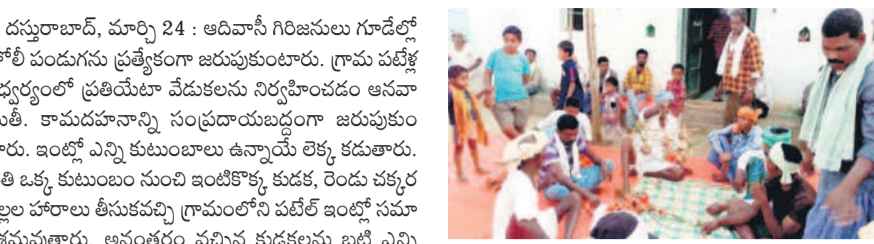
దస్తరాబాద్ : కామని దువానానికి ఏర్పాటు చేస్తున్న కుల పెద్దలు

దస్తరాబాద్, మార్చి 24 : ఆదివాసీ గిరిజనులు గూడెల్లో హోలీ పండుగను ప్రత్యేకంగా జరుపుకుంటారు. గ్రామ పట్టణ అధ్యక్షులతో ప్రతియేటా వేడుకలను నిర్వహించడం ఆనవాయితీ. కామదహనాన్ని సంప్రదాయబద్ధంగా జరుపుకుంటారు. ఇంట్లో ఎన్ని కుటుంబాలు ఉన్నాయో లెక్క కడుతారు. ప్రతి ఒక్క కుటుంబం నుంచి ఇంటికి కుడక, రెండు చక్కర బిల్లల హారాలు తీసుకవచ్చి గ్రామంలోని బహిష్కరించిన వాళ్లకు వేడుకలు తెలుపుతారు. అనంతరం వచ్చిన కుడకలను బట్టి ఎన్ని కుటుంబాలు ఉన్నాయో అదే వారి లెక్క. ఆదివాసీ గ్రామంలో కామదహనంతో మాత్రం, మాత్రం (ముసలవ్వ, ముసలయ్య) నామంతో రెండు పాడవాటి వెదురు కర్రలను తీసుకొని వాటికి కొన భాగంలో వాలుగా చతుస్రాకారంలో సన్నని పట్టిలకు కుడక, ఉల్లిగడ్డలు, గాలి, వంకాయలను వేలాడ చేస్తారు. ఆ తరువాత పాడగాలి కర్రలకు కింది భాగంలో నిప్పు పెట్టడం (కామ దహనం) చేయడం జరుగుతుంది. ఇందులో (మాతరి ముసలవ్వ-మాత్రం ముసలయ్య)గా అభివేదించారు. వెదురు బొంగులకు అలకరించిన మాతరి, మాత్రంను డబ్బు, డోలు, వాయిద్యాల చప్పుళ్లతో గ్రామ పోలీసుల వరకు తీసుకవచ్చి కామ దహనం గోండుల ఆచార వ్యవహారాలతో నిర్వహిస్తారు. దహనం చేసిన అగ్నిగుండం చుట్టూ సంప్రదాయ పద్ధతిలో నృత్యాలు చేస్తూ హోలీ సమురాలు జరుపుకుంటారు. కామ దహనంలో ఏది ముందుగా పడితే అదే ఈ సంవత్సరం వాళ్ల అధ్యక్షుల సంవత్సరంగా భావిస్తారు. అయితే ఆ సమయంలో కొత్తగా పెండ్లి చేసుకుంటారో, తల్లిదండ్రుల నుంచి వేరుపడిన కొడుకు-కొడతల్లి కుడక