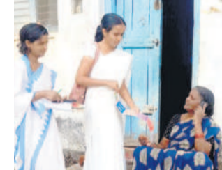
నిర్మల్లో సర్వే చేస్తున్న వైద్య సిబ్బంది

ముఖోల్, మార్చి 24 : జైంసా పట్టణంలోని కాంగ్రెస్ పార్టీ కార్యకర్తల సమావేశానికి హాజరైన మంత్రి సీతకృష్ణ ముఖోల్ ను మున్సిపాలిటీ చేయాలని కోరుతూ మాజీ ఎంపీటీసీ పోతన్న యాదవ్ విసే పత్రాన్ని అందజేశారు. ముఖోల్లో 25 వేల జనాభాతోపాటు 12వేల పైలెట్లకు ఓటర్ల గిర్నాల్లో తెలిపారు. మున్సిపాలిటీ అయితే ముఖోల్ అభివృద్ధి చెందుతుందని పేర్కొన్నారు.