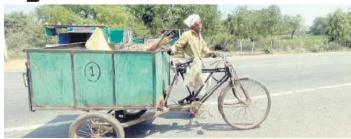
దిలావర్పూర్లో పంచాయతీ అధ్యక్షులతో లివేర్ చేసి వినియోగిస్తున్న చెత్తబండి

దిలావర్పూర్ మార్చి 24 : ప్రతి ఇంటి నుంచి చెత్తను సేకరించేందుకు పంచాయతీ అకు మూడు చక్రాల బండిని ప్రభుత్వం కొనుగోలు చేసి ఇచ్చింది. ఇటీవల ఈ బండిని రోడ్డు పక్కన చెత్తలో పడేయగా, చెత్తలో బండి