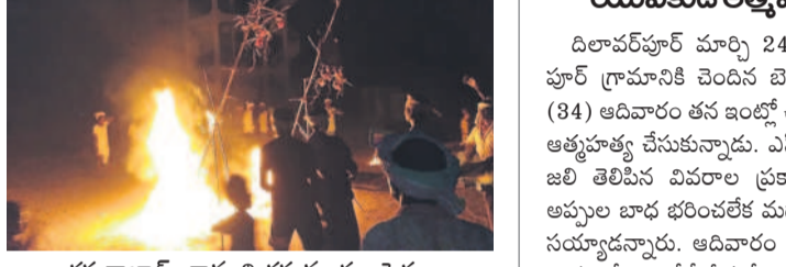
దస్తరాబాద్ : కామని దహనం కుల పెద్దలు