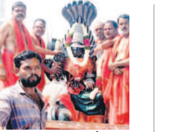
రేణుకమాత విగ్రహాన్ని ఊరేగింపుగా తీసుకవచ్చున్న భక్తులు