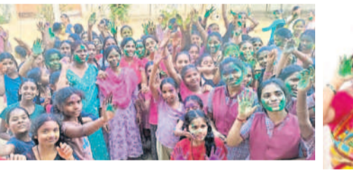
కుంటూరు : కల్లూరు కేజీవీలో హోలీ పండుగ జరుపుకుంటున్న ఏర్పాట్లు, ఉపాధ్యాయులు

దస్తరాబాద్, మార్చి 24 : మండలంలోని బుట్టపూర్, రేవోజీపేట, తదితర గ్రామాలలో అదివారం హోలీ వేడుకలను జరుపుకున్నారు. చిన్న పెద్ద రంగుల చల్లుకుంటూ ఉత్సాహంగా గడిపారు. మహిళలు, విశిష్టతను వివరించారు. మండలంలోని కొన్ని సెంటర్లలో కామదహనం నిర్వహించారు.