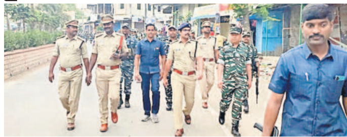
కవాతులో పాల్గొన్న పిఎస్సీ కాంటిలెట్ పోలీస్, సీబి రాజారెడ్డి

జైంసా, మార్చి 24 : పట్టణంలో ఆదివారం కేంద్ర బలగాలతో పోలీసులు కవాతు నిర్వహించారు. పిఎస్సీ కాంటిలెట్ పోలీస్ మాట్లాడుతూ, ప్రజలు ఎలాంటి ప్రలోభాలకు, భయభ్రాంతులకు లోనుకాకుండా