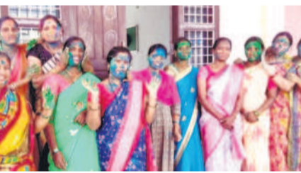
దస్తరాబాద్ : హోలీ వేడుకలను నిర్వహించుకుంటున్న కేజీవీ ఉపాధ్యాయులు, సిబ్బంది