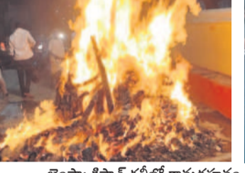
జైంసా: కిసాన్ గేట్లో కామదహనం

సోన్, మార్చి 24 : సోన్, నిర్మల్ మండలంలోని ఆయా గ్రామాలలో అదివారం రాత్రి కామదహనం కార్యక్రమాన్ని నిర్వహించారు. గ్రామంలోని వివిధ ప్రాంతాల్లో నుంచి పెద్దకులు,