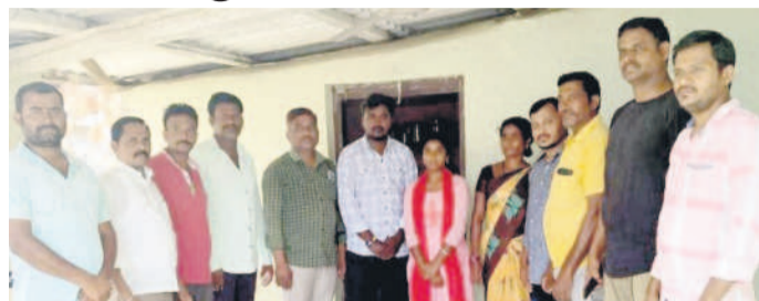
పాత ఎల్లాపూర్లో పేద కుటుంబానికి సాయం అందజేస్తున్న మిత్రులు