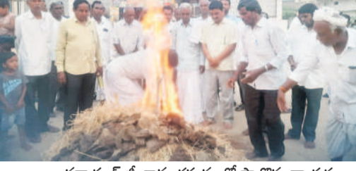
నర్సాపూర్ జి : కామ దహనంలో పాల్గొన్న నాయకులు