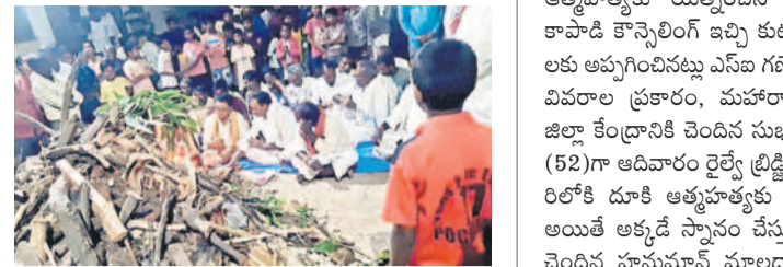
సోన్లో కామదహనం నిర్వహిస్తున్న గ్రామస్థులు

దస్తరాబాద్, మార్చి 24 : ఆదివాసీ గిరిజనులు గూడెల్లో హోలీ పండుగను ప్రత్యేకంగా జరుపుకుంటారు. గ్రామ పట్టణ అధ్యక్షులతో ప్రతియేటా వేడుకలను నిర్వహించడం ఆనవాయితీ. కామదహనాన్ని సంప్రదాయబద్ధంగా జరుపుకుంటారు. ఇంట్లో ఎన్ని కుటుంబాలు ఉన్నాయో లెక్క కడుతారు. ప్రతి ఒక్క కుటుంబం నుంచి ఇంటికి కుడక, రెండు చక్కర బిల్లల హారాలు తీసుకవచ్చి గ్రామంలోని బహిష్కరించిన వాళ్లకు వేడుకలు తెలుపుతారు. అనంతరం వచ్చిన కుడకలను బట్టి ఎన్ని కుటుంబాలు ఉన్నాయో అదే వారి లెక్క. ఆదివాసీ గ్రామంలో కామదహనంతో మాత్రం, మాత్రం (ముసలవ్వ, ముసలయ్య) నామంతో రెండు పాడవాటి వెదురు కర్రలను తీసుకొని వాటికి కొన భాగంలో వాలుగా చతుస్రాకారంలో సన్నని పట్టిలకు కుడక, ఉల్లిగడ్డలు, గాలి, వంకాయలను వేలాడ చేస్తారు. ఆ తరువాత పాడగాలి కర్రలకు కింది భాగంలో నిప్పు పెట్టడం (కామ దహనం) చేయడం జరుగుతుంది. ఇందులో (మాతరి ముసలవ్వ-మాత్రం ముసలయ్య)గా అభివేదించారు. వెదురు బొంగులకు అలకరించిన మాతరి, మాత్రంను డబ్బు, డోలు, వాయిద్యాల చప్పుళ్లతో గ్రామ పోలీసుల వరకు తీసుకవచ్చి కామ దహనం గోండుల ఆచార వ్యవహారాలతో నిర్వహిస్తారు. దహనం చేసిన అగ్నిగుండం చుట్టూ సంప్రదాయ పద్ధతిలో నృత్యాలు చేస్తూ హోలీ సమురాలు జరుపుకుంటారు. కామ దహనంలో ఏది ముందుగా పడితే అదే ఈ సంవత్సరం వాళ్ల అధ్యక్షుల సంవత్సరంగా భావిస్తారు. అయితే ఆ సమయంలో కొత్తగా పెండ్లి చేసుకుంటారో, తల్లిదండ్రుల నుంచి వేరుపడిన కొడుకు-కొడతల్లి కుడక