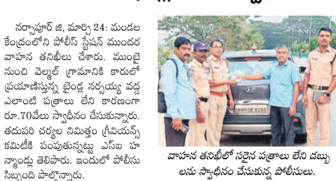
వాహన తనిఖీలో సరైన పత్రాలు లేని డబ్బులను స్వాధీనం చేసుకున్న పోలీసులు.