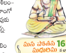
మీని సోశినీ 165 ఏషిరియం 2340

తుడు సారాన్ని స్వీకరించే శీలం- స్వభావం కలవాడు. 'శుభాంగో లోక సారంగ' అని విష్ణువుకు నామాలు. పాలసారం వెన్న. బాలకృష్ణుడు నవనీత క్షీరుడు. వెన్నను దొంగిలిం చైనా తింటాడు. చిన్నది కాని, పెద్దది కానీ- ఏ కర్మ చేసినా, ఆ కర్మను చూడక దాని సారం గ్రహిస్తాడు. గోపికలు ఎంత ప్రేమతో వెన్న తినిస్తారో, ఆ ప్రేమ కావాలి పరమాత్మకి. కంసారి (కృష్ణుని) చరణలకు సంస్కర ణమే సంసారంలోని సారం! భవసారం స్వీకరించి అనుభవించడమే సూరి- పండిత లక్షణం.