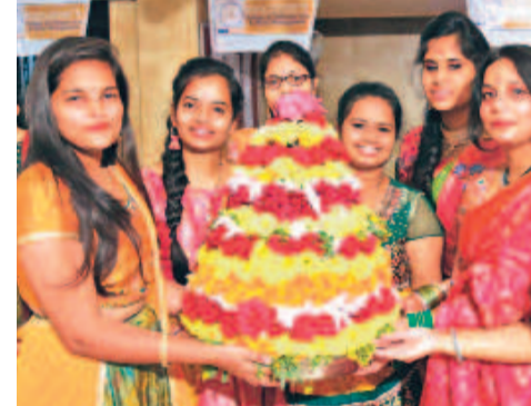
పండుగ. ప్రతి రెండేళ్లకు ఒకసారి జరుగుతుంది. కోటికి పైగా భక్తులు ఈ జాతరను సందర్శిస్తారు.

తెలంగాణలో ప్రధానమైన నదులు, చెరువులు కలిగి ఉండటం వల్ల క్రూయిజ్ టూరిజం అభివృద్ధికి అవకాశాలు ఎక్కువ. • బోటులో షికారుతో కూడిన టూరిజాన్ని క్రూయిజ్ టూరిజం అంటారు. కృష్ణా, గోదావరి నదుల్లో దీన్ని బాగా అభివృద్ధి చేశారు. గోదావరిలో పట్టిసీమ నుంచి పాపికొండ వరకు జరిగే టూరిజం కృష్ణానదిలో నాగార్జున సాగర్ నుంచి శ్రీశైలం వరకు ఏర్పాటు చేసిన బోటు షికారు. • హైదరాబాద్ హుస్సేన్ సాగర్లో క్రూయిజ్ టూరిజం అభివృద్ధి చెందింది. • లక్కవరం సరస్సులో క్రూయిజ్ టూరిజం బాగా అభివృద్ధి చెందింది.