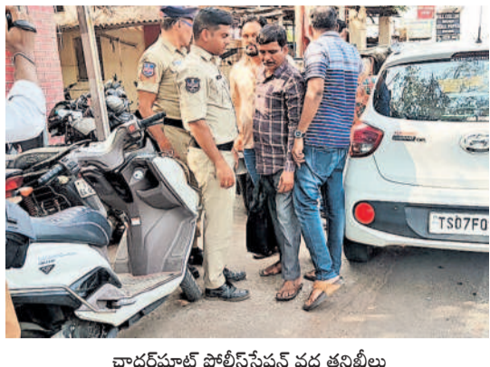
చాదర్ ఫూల్ పోలీస్ స్టేషన్ వద్ద తనిఖీలు