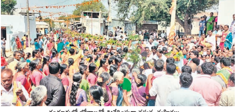
కందూరులో బోనాలతో ఊరేగింపుగా వస్తున్న మహిళలు

దుర్లో భాగంగా గురువారం జములమ్మకు గ్రామంలోని ప్రతి ఇంటి నుంచి ఇష్టమైన నైవేద్యాలను నూతన పాత్రలలో వండి బొట్లతో అలంకరించారు. అనంతరం భాజాభజంత్రీలు, డోలు, డప్పుల మోతల మధ్య బోనాలతో మహిళలు భారీ ఊరేగింపుగా బయలుదేరారు. ఆలయం చుట్టూ ప్రదర్శింపబడిన అమ్మవారికి నైవేద్యాలను సమర్పించి దూరు గ్రామస్థులు వేడుకున్నారు. జములమ్మ విగ్రహ మంతో నాలుగు రోజులుగా జములమ్మ విగ్రహ పునఃప్రతిష్ఠ ముహూర్తము నిర్వహిస్తున్నారు. అం