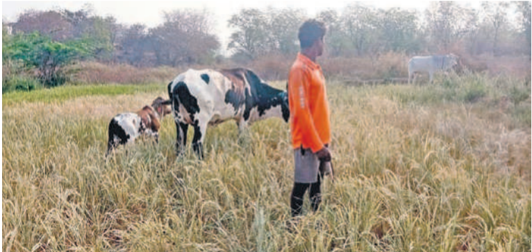
మాసాపేట మండలంలో ఎండిన వరి పంటను పశువులకు మేపుతున్న రైతు

మంగా ఇప్పకపోవడంతోపాటు భూగర్భ జలాలు అడుగంటి పోవడంతో చేతికందినవచ్చిన పంట పూర్తిగా ఎండిపోయింది. దీంతో చేసేది లేక బాలయ్య పంటను పశువుల మేతకు వదిలేశాడు. కాంగ్రెస్ ప్రభుత్వం రైతులపై కక్ష పూరితంగా వ్యవహరిస్తున్నదని, అందుకే రైతుబంధు విడుదల చేయడం లేదని, వ్యవసాయానికి కరెంటు కూడా సక్రమంగా సరఫరా చేయడం లేదని పలువురు రైతులు ఆగ్రహం వ్యక్తం చేస్తున్నారు.