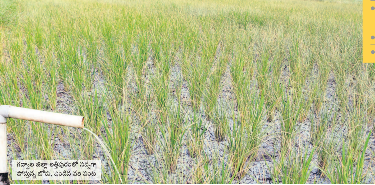
గద్వాల జిల్లా లత్తిపురంలో సన్నగా పోస్తున్న బోరు, ఎండిన వరి పంట