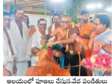
రైతులతో మాట్లాడుతున్న మాజీ ఎమ్మెల్యే ఆల ఆలయంలో పూజలు చేస్తున్నవేద పండితులు

రామలింగేశ్వరస్వామి బ్రహ్మాత్మవాల సందర్భంగా వచ్చే భక్తులకు ఏలాంటి ఇబ్బందులు లేకుండా ఏర్పాట్లను చేసినట్లు ఆలయ ఈవో రాజేశ్వరశర్మ తెలిపారు. స్వామి దర్శనం కోసం వచ్చే భక్తులకు తప్పింకా నిలిచి ఉండడానికి నీడ, తాగునీటి వసతి తదితర ఏర్పాట్లు చేసినట్లు నిర్వాహకులు తెలిపారు.