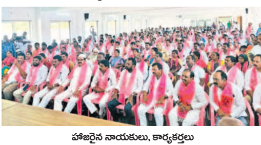
హజ్రత్ సయ్యదులు, కార్యకర్తలు