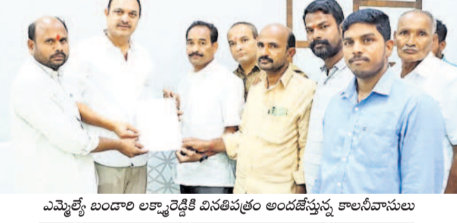
ఎమ్మెల్యే బండారి లక్ష్మారెడ్డికి వినతిపత్రం అందజేస్తున్న కాలనీ నివాసులు

ఉప్పల్, మార్చి 21: కాలనీ సమస్యల పరిష్కారానికి చర్యలు చేపట్టామని ఉప్పల్ ఎమ్మెల్యే బండారి లక్ష్మారెడ్డి అన్నారు. ఉప్పల్ లక్ష్మారాయణకాలనీలోని డ్రైనేజీ సమస్యల పరిష్కారంపై గురువారం కాలనీ నివాసులు గురువారం ఎమ్మెల్యేను కలిశారు. ఈ సందర్భంగా సమస్యలను వివరిస్తూ వినతిపత్రం అందజేశారు. ఆ సందర్భం ఎమ్మెల్యే మాట్లాడుతూ ప్రజల ఆకాంక్షలకు అనుగుణంగా కృషి చేస్తున్నామని చెప్పారు. ప్రజలకు కృషి చేస్తున్నామని చెప్పారు. ప్రజలకు కృషి చేస్తున్నామని చెప్పారు.