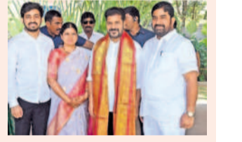
సీఎం రేవంత్ రెడ్డిని కలిసిన జంగారెడ్డి

కందుకూరు-మార్చి 21 : కందుకూరు-దెబ్బ డగూడ రోడ్డుకు రూ. 2.50 కోట్ల రూపాయలకు మంజూరు చేస్తున్నట్లు రాష్ట్ర పంచాయతీ రాజ్ శాఖ మంత్రి సీతక్క తెలిపారు. ఈ నెల 4వ తేదీన సమస్త తెలంగాణలో అధ్యక్షుడు కందుకూరు, దెబ్బ డగూడ రోడ్డు అనే కడనానికి స్పృ