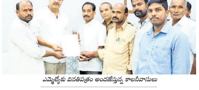
ఎమ్మెల్యేకు వినతిపత్రం అందజేస్తున్న కాలనీవాసులు

ఉప్పల్, మార్చి 21: కాలనీ సమస్యల పరిష్కారానికి చర్యలు చేపట్టామని ఉప్పల్ ఎమ్మెల్యే బండారి లక్ష్మారెడ్డి అన్నారు. ఉప్పల్ లక్ష్యాధారణ కాలనీలోని డైనేజీ సమస్యల పరిష్కారంపై కోపాంతరం కాలనీవాసులు గురువారం ఎమ్మెల్యేను కలిశారు. ఈ సందర్భంగా సమస్యలను వివరిస్తూ వినతిపత్రం అందజేశారు. ఆనంతరం ఎమ్మెల్యే మాట్లాడుతూ ప్రజల ఆకాంక్షలకు అనుగుణంగా పనులు పూర్తిచేస్తున్నామని చెప్పారు. ప్రజల అలక బాధను హామీలు నడపేస్తామని జిల్లా అధికారి మేరీ రిఖా, మండల వ్యవసాయ అధికారి అర్జున్, కంపెనీ సీనియర్ సాఫ్ట్వేర్ ఇంజనీర్లు, సైబర్ సెక్యూరిటీ, ఐటీ అంశాలలో విద్యార్థులకు గుండపోత వంటి ముఖ్యమైన పాఠశాల కార్యదర్శి టీపీ రెడ్డి ఇంజనీరింగ్ కళాశాల కార్యదర్శి టీపీ రెడ్డి అన్నారు. గురువారం కళాశాల ప్రముఖ బహుళ జాతి సంస్థ ఇన్స్టిట్యూట్ అండ్ డిజిటల్ స్కూల్ (ఇడిఎస్)తో ఒప్పందం కుదుర్చుకుంది. ఈ సందర్భంగా ఆయన మాట్లాడుతూ విద్యార్థులను నేరగా పరిశ్రమలకు పని చేసే లక్ష్యంతో ఈ ఒప్పందం చేసుకున్నామని