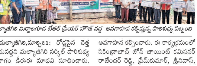
మల్కాజ్ గిరి మిల్లాలగూడ బీజేఆర్ హోల్ వద్ద అవగాహన కల్పిస్తున్న పాలశుభ్ర నిబంధి

మల్కాజ్ గిరి, మార్చి 21: రోడ్లపై చెత్త వేయవద్దని మల్కాజ్ గిరి సర్కిల్ పాలశుభ్ర నిబంధి మిల్లాలగూడ బీజేఆర్ హోల్ వద్ద, గురువారం మల్కాజ్ గిరి సర్కిల్ మిల్లాలగూడలోని మేతల్ డ్రాయర్ హోల్ వద్ద రోడ్లపై చెత్త వేయవద్దంటూ స్థానికులకు సజ్జానీ