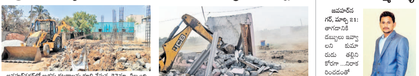
జవహర్ నగర్ లో అక్రమ కట్టడాలను కూల్చివేస్తున్న రెవెన్యూ సిబ్బంది

కీసర్, మార్చి 21: అసైన్డ్ భూమిలో అక్రమ నిర్మాణాలు చేపడితే కఠిన చర్యలు తప్పవు అనే తీరుతో అధికారులు హెచ్చరించారు. మండల పరిధి వీరాలలోని అసైన్డ్ భూమిలో సర్కిల్ నంబర్ 5లో అక్రమ నిర్మాణాలు, వీరాలలోని ఎఫ్ టీ, బఫర్ జోన్ లో వెలసిన అక్రమ నిర్మాణాలను గురువారం వారు జేసీబీతో కూల్చివేయించారు.