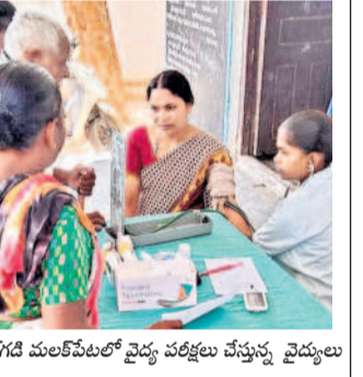
లాల్ గడి మలకేపేటలో వైద్య పరీక్షలు చేస్తున్న వైద్యులు