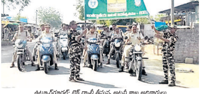
ఉమ్మారులరల్: బైక్ రైల్వే తీస్తున్న అటవీ శాఖ అధికారులు