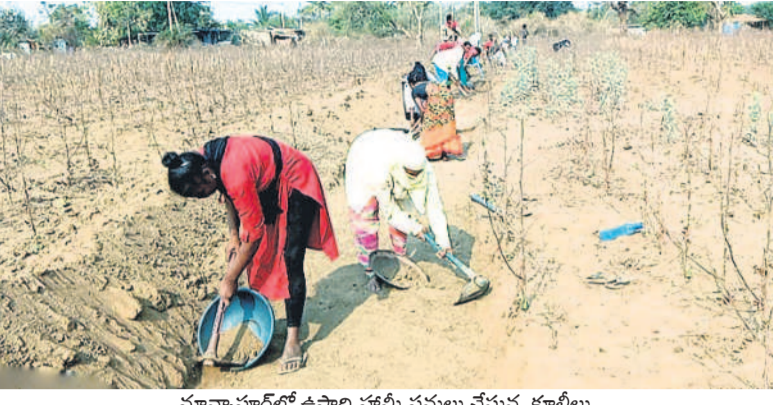
మాన్యూవర్లలో ఉపాధి హామీ పనులు చేస్తున్న కూలీలు

• నార్కట్, గాదిగూడ మండలాల్లో 19,139 జాబ్ కార్డులు • ప్రస్తుతం రోజుకు సుమారు 4వేల మంది హాజరు • కూలీల సంఖ్య పెంచాలని జిల్లా అధికారులు కేంద్రస్థాయి సిబ్బందిపై ఒత్తిడి తీసుకోచ్చి పదేపదే చెబుతున్నా కూలీల సంఖ్య మాత్రం పెరగడం లేదు. అందుకు ప్రధాన కారణం పెరిగిన ధరలకు అనుగుణంగా ఉపాధి వేతనాలు అందకపోవడమేనని పలువురు కూలీలు వాపోతున్నారు. సాధారణంగా బయట ఏ పనికి వెళ్లినా కనీసం రోజుకు రూ.500 వరకు వస్తుంది. కానీ అదే ఉపాధి హామీ పనులకు వెళ్లి వారానికి కనీసం రూ.800 కూడా రావడం లేదని చెబుతున్నారు.