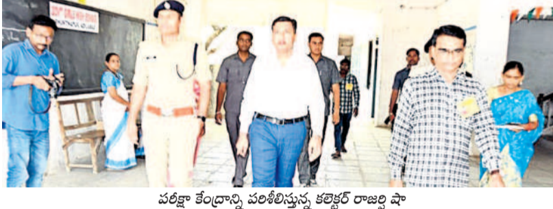
పరీక్షా కేంద్రాన్ని పరిశీలిస్తున్న కలెక్టర్ రాజబ్ది షా

ఆదిలాబాద్ రూర్, మార్చి 21: ఆదిలాబాద్ లోని పలు పరీక్షా కేంద్రాలను గురువారం కలెక్టర్ రాజబ్ది షా, ఎస్సీ గొప్ప అలంతో పరీక్షా కేంద్రాలను పరిశీలించారు. ప్రభుత్వ బాలికల ప్రాథమికాన్నత పాఠశాలలో ఏర్పాటు చేసిన పదో తరగతి పరీక్షా కేంద్రాన్ని తనిఖీ చేశారు. విద్యార్థులు పరీక్ష రాస్తున్న తీరును పరిశీలించారు. విద్యార్థుల ఎలంటి జబ్బులను కలగకుండా అన్ని ఏర్పాట్లు చేయాలని సిబ్బందికి సూచించారు. వారి వెంట ఎంకాఫో జయశీల ఉన్నారు. పరీక్షలపై ఫిక్ సమాచారాన్ని నమస్కరించి