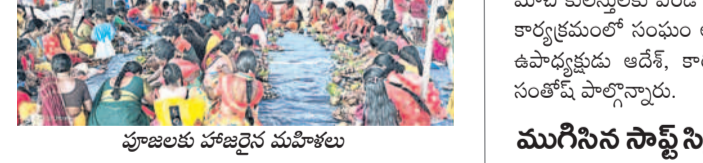
పూజలకు హాజరైన మహిళలు

బోధ, మార్చి 21 : కౌట(బీ) గ్రామంలో పెద్దమ్మ తల్లి విగ్రహావిష్కరణలో భాగంగా గురువారం అలయ ప్రాంగణంలో ప్రత్యేక పూజలు, హోమం నిర్వహించారు. మహిళలు మంగళహారతులతో తరలివచ్చి పూజలు పాల్గొన్నారు. శుక్రవారం పెద్దమ్మ తల్లి, పోతరాజు జంటనాగుల విగ్రహాలను ప్రతిష్ఠించి ప్రాణ ప్రతిష్ఠా చేయనున్నారు. కార్యక్రమంలో ముదిరాజ్ సంఘం నాయకులు, గ్రామస్థులు పాల్గొన్నారు.