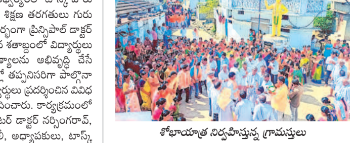
శోభారాత్ నిర్వహిస్తున్న గ్రామస్థులు

బోధ, మార్చి 21 : కన్నకొద్ది గ్రామంలో శబరమాత విగ్రహ ప్రతిష్ఠాపన వేడుకలు గురువారం ప్రారంభమయ్యాయి. మొదటి రోజు ఆశ్రమంలో హోమం నిర్వహించారు. అనంతరం గ్రామంలో అమ్మవారి పాదకులు, చిత్రపటాన్ని ట్రాక్టర్లో ఉర్రోలించారు. ఆశ్రమంలో భక్తులు ప్రత్యేక పూజలు చేశారు. శుక్రవారం విగ్రహాన్ని ప్రతిష్ఠించనున్నారు. కార్యక్రమంలో గ్రామంలో పాటు ధన్వార్తి(బీ), కాశ(బీ), తేజాపూర్, గిర్నూర్, సుంకిడి గ్రామాల నుంచి పెద్ద సంఖ్యలో భక్తులు తరలివచ్చారు.