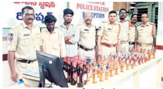
పట్టుకున్న మద్యం సీసాలతో పోలీసులు