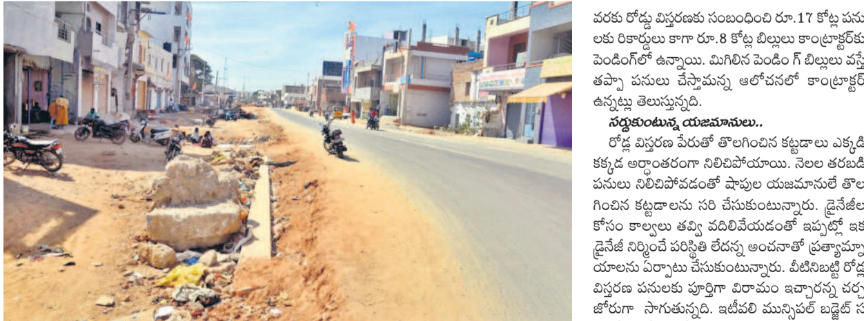
అర్ధాంతరంగా నిలిచిపోయిన రోడ్డు విస్తరణ పనులు

జిల్లా కేంద్రంలో రోడ్డు విస్తరణను రూ. 49.75 కోట్ల అంచనాతో చేపట్టారు. గత ఏడాదిలో ప్రారంభమైన ఈ పనులను నాలుగు విభాగాలుగా చేశారు. వీటిలో విద్యుత్ రోడ్డు, గోపాలపేట రోడ్డు, పాన్ గల్ రోడ్డు, వెళ్ళే రోడ్డు ఉన్నాయి. వీటిలో విద్యుత్, గోపాలపేట రోడ్డు పనులు కొంతమేర జరిగాయి. గోపాలపేట రోడ్డు వైపు విస్తరణలో మూడు కిలోమీటర్ల రోడ్డుంటే, 2.85 కిలో మీటర్ల రోడ్డును పూర్తి చేశారు. మరో రెండు ట్రిప్లి ఉండగా, ఒకటి జెర్మీకుల వైపునగా గర్గర ఉంటే, మరొకటి పట్టణంలోని రామ టాకీస్ గర్గర నిర్మించారు. కేవలం రామ టాకీస్ గర్గర మాత్రమే రోడ్డు వేయాలి