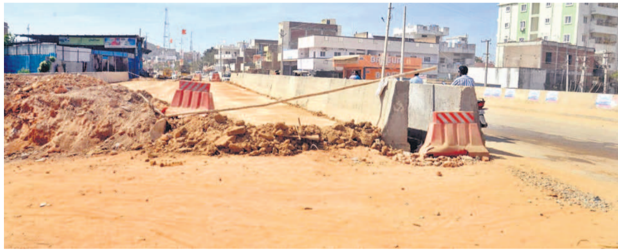
వనపర్తి పట్టణంలో అసంపూర్ణగా ట్రిప్లి నిర్మాణ పనులు