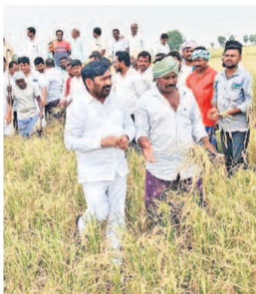
నల్లగొండ జిల్లా మిర్యాలగూడ మండలం యాదాద్రిపల్లిలో రైతులతో కలిసి ఎండిన పొలాలను పరిశీలిస్తున్న మాజీ మంత్రి జగదీశ్ రెడ్డి, బీఆర్ఎస్ నేతలు

హైదరాబాద్, మార్చి 20 (నమస్తే తెలంగాణ): రాష్ట్రంలో పంట నష్టపోయిన ప్రతి రైతుకు ఎకరానికి రూ. 10 వేలు చొప్పున ఇచ్చి ఆదుకోవాలని ప్రభుత్వాన్ని బీఆర్ఎస్ మాజీ మంత్రి సింగిరెడ్డి నిరంజన్ రెడ్డి డిమాండ్ చేశారు. పడంగడ్లలో పాటుగా నీళ్లు కరెంటు లేక ఎండిపోయిన పంటలకు ప్రభుత్వం నష్టపరిహారం అందించాలని కోరారు. పంటలు నష్టపోయి పుట్టడు దుఃఖంలో ఉన్న రైతులకు భరోసా కల్పించేందుకు సీఎం, మంత్రులు వెంటనే ఆయా ప్రాంతాల్లో పర్యటించాలని సూచించారు. బుద్వారం తెలంగాణ భవన్లో ఆయన మీడియా సమావేశంలో మాట్లాడారు. రేవంత్ సర్కార్ ది అన్ని రంగాల్లో మోసం, వంచన అని ఆవ్యాధులు. ప్రాజెక్టులు గేట్లు ఎత్తవద్దని రాజకీయ గేట్లు ఎత్తవద్దని రేవంత్ రెడ్డి అంటున్నారని ఎద్దేవా చేశారు. ఆకాల పరాలతో పంటలకు తీవ్ర నష్టం జరిగిందని, రైతులు బాధలో ఉంటే ఒక్క >2వ పేజీలో