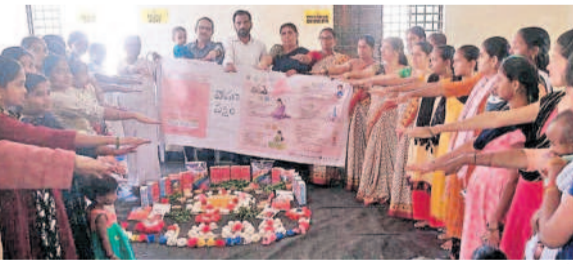
పోషణ పక్షం కార్యక్రమంలో పాల్గొన్న గర్భిణులు, బాలింతలు, అంగన్ వాడీ బీదర్లు