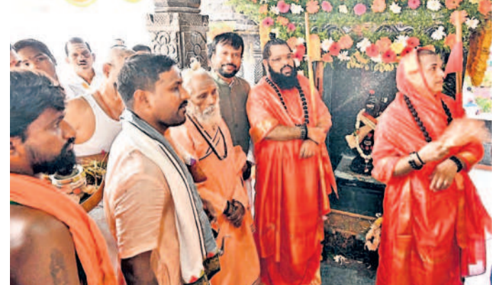
నాగోల్లోని బసవేశ్వరకాలనీలో నూతనంగా ఏర్పాటు చేసిన ఆలయాల పూజా కార్యక్రమంలో పాల్గొన్న ఉమ్మడి శ్రీనివాసగుప్త