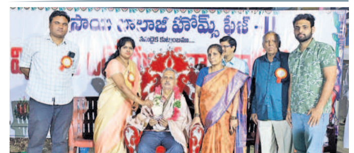
బడంగపేట మున్సిపల్ కార్పొరేషన్ పరిధిలోని సాయి బాలాజీ హోమ్స్ కాలనీలో వివిధ హోదాల్లో ప్రభుత్వ ఉద్యోగులను పదవీ విరమణ పొందిన వారిని బడంగపేట మేయర్ విగిరింత పాఠశాలలో సన్మానించిన సందర్భంగా

మన్యూరాబాద్, మార్చి 20: నాగోల్, మమతానగర్, బసవేశ్వరకాలనీలో శ్రీశైల మల్లికార్జున సమాజోత్సావ ఫౌండేషన్ (ప్రస్) ఆధ్వర్యంలో బుధవారం ప్రభుత్వం సహకారం మల్లికార్జున స్వామి శ్రీ ఆదిజగద్గురు పండితారాధ్య విగ్రహ ప్రాణ ప్రతిష్ఠ, శ్రీ మహాకృష్ణ బసవేశ్వర ఆకర్షణ మహాదేవి విగ్రహావిష్కరణ కార్యక్రమానికి ముఖ్య అతిథిగా పాల్గొన్నారు.