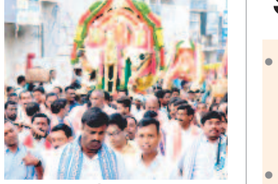
ఊరేగింపులో వెళ్తున్న స్వామివారి ఉత్సవ మూర్తులు