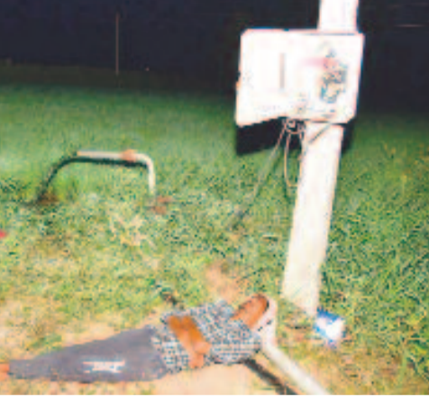
రాత్రిపూట బావి వద్ద నిద్రాస్తున్న తమ్మనవేరి ఓదెలు