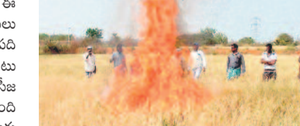
నీళ్లులేక ఎండిపోయిన వరి పంటను తగులబెడుతున్న ఇల్లంతకుంట మండలం పెద్దలింగాపూర్ రైతులు(ఫైల్)

అయితే పగటి పూట కరెంటు సకాయిస్తున్నది. లోపల్లోనే రావడంతో మోటర్లు కాలిపోవడమే కాదు ఫీజులు కొట్టివే స్తున్నాయి. దీంతో రాత్రి 11 గంటలనుంచి ఇచ్చే ట్రీఫెస్ కరెంటును వినయోగించుకునేందుకు రాత్రి పూట పొలం వద్ద పడుకుంటున్నారు. రాత్రి 11 నుంచి తెల్లవారు జామున 4గంటల వరకు ఊరిన నీటిని ఊరినట్టుగా.. పొలాలుకు ప్రత్యేకంగా పైపైలతో పారొస్తున్నారు. ఇంత చేస్తున్నా సదరు పంట చేతికి వచ్చే పరిస్థితి మాత్రం కని పించడం లేదని రైతులు ఆందోళన వ్యక్తం చేస్తున్నారు. ఈ నేపథ్యంలో ఒక్కసారైనా ఇరుకల్ల వాగులోకి నీళ్లు విడు దల చేయాలని కోరుతున్నారు. పదేళ్ల క్రితం పరిస్థితి మళ్లీ వచ్చిందంటూ ఆవేదన చెందుతున్నారు.