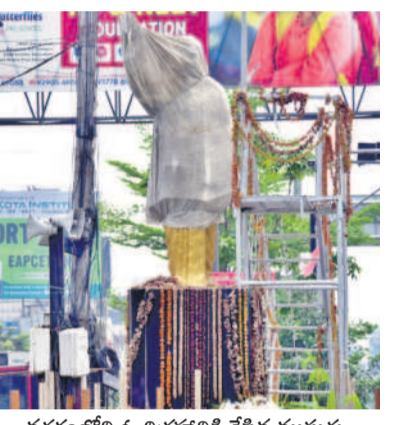
నగరంలోని ఓ విగ్రహానికి వేసిన ముసుగు

కరీంనగర్, మార్చి 19 (నమస్తే తెలంగాణ) : పార్లమెంట్ ఎన్నికల షెడ్యూల్ విడుదలైన మరుక్షణం (ఈ నెల 16) నుంచే ఎన్నికల కోడ్ అమల్లోకి వచ్చింది. ఇది ఎన్నికల ప్రక్రియ ముగిసే వరకే ఉంటుంది. జూన్ 6వ తేదీ దాకా కొనసాగుతున్నది. ఎన్నికల్లో ప్రలోభాలను అడ్డుకునేందుకు కేంద్ర ఎన్నికల సంఘం సీరియస్ గా చర్యలు తీసుకుంటుంది. ఉమ్మడి జిల్లా పరిధిలో నిఘా పెంచారు. చెక్ పోస్టులు ఏర్పాటు చేసి, తనిఖీలు ముమ్మరం చేశారు. ప్రతి వాహనాన్ని క్షణంగా తనిఖీ చేస్తున్నారు. ఇప్పటికే పలుచోట్ల ఆధారాలు లభించాయి. ప్రతి వాహనంపై సీజే చేస్తున్నారు. ఈ పరిస్థితుల్లో సామాన్య ప్రజలు జాగ్రత్తలు తీసుకోవాల్సి అవసరమవుతుంది. బ్యాలెట్ నుంచి నగదును ద్రా చేస్తే సంబంధిత స్టేట్ మెంట్, ఏటీఎం ద్వారా డ్రా చేస్తే దానికి సంబంధించిన రసీదు తప్పనిసరిగా తనిఖీ దగ్గర ఉంచుకోవాలి. ₹50వేలకు మించిన నగదు, అంత విలువైన బంగారం ఆధారాలు లేకుండా తరలించరాదు. పోలీసుల తనిఖీలో పట్టుబడితే తప్పనిసరిగా ఆధారాలు చూపించాల్సి ఉంటుంది. లేదంటే ఈ నగదును, బంగారాన్ని సీజే చేసి కోర్టుకు స్వాధీనం చేస్తారు. ఎక్కువ మొత్తంలో నగదు, బంగారం పట్టుబడితే క్రిమినల్ కేసులు నమోదు చేస్తారు. అంతే కాకుండా, ఇటీవల అప్పగించిన లెక్కలు చెప్పాల్సి వస్తుంది. గిఫ్టులు తరలించినా అవి అక్రమమని భావిస్తే తప్పనిసరిగా సీజే చేసి అధికారం ఎన్నికల అధికారులకు