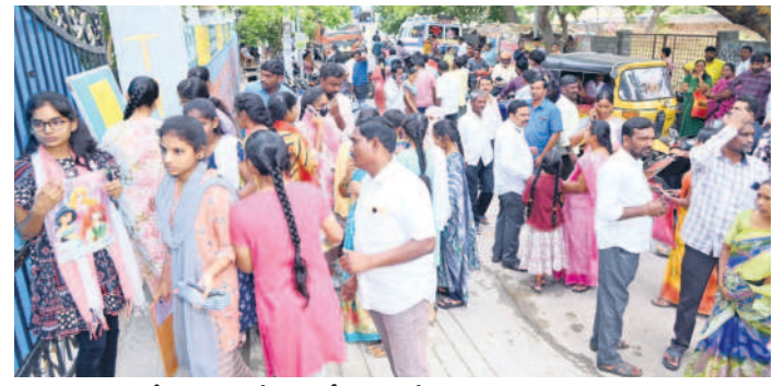
సూర్యాపేట : జిల్లా కేంద్రంలోని పరీక్ష కేంద్రం వద్ద డాం అలాబ్ మెంట్స్ మాసుకుండున్న విద్యార్థులు

సెంటర్లలో 465 మంది విద్యార్థులకు గాను 464 మంది హాజరైనట్లు ఎంపీపీ తెలిపారు. నేరేడుపర్తి : పట్టణంలోని జడ్పీఐ చౌవ్వూరి, ప్రగతి పాఠశాలలో ఏర్పాటు చేసిన పరీక్ష కేంద్రాల్లో మొత్తం 639 మంది విద్యార్థులు పది పరీక్షల హాజరు కావాల్సి ఉండగా 638 మంది హాజరయ్యారు. పరీక్ష కేంద్రాల పాఠశాలను అందుబాటులో ఉంచారు. కేంద్రాల వద్ద 144 సెక్షన్ల అమలు చేశారు. గరిడేపల్లి : మండల కేంద్రంలోని జడ్పీఐ చౌవ్వూరి, కేటీబీ పరీక్ష కేంద్రాల్లో 208 మంది విద్యార్థులకు గాను అందరూ హాజరైనట్లు సీఎం రెండు సెంటర్లలో 690 మంది విద్యార్థులకు గాను 688 మంది పరీక్షల హాజరైనట్లు ఎంపీపీ సైదానాయక్ తెలిపారు. మునగాల : మండల కేంద్రంలోని జిల్లా పరీక్ష కేంద్రంలోని మూడు