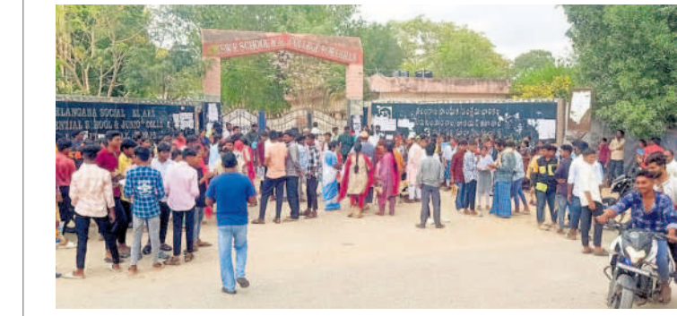
మతంపల్లి : సాంఘిక సంక్షేమ గురుకుల పాఠశాల పరీక్ష కేంద్రం వద్ద పడో తరగతి విద్యార్థులు

సూర్యాపేట రూరల్, మార్చి 18 : పడో తరగతి పరీక్షలు జిల్లా వ్యాప్తంగా సోమవారం ప్రశాంతంగా ప్రారంభమయ్యాయి. ఉదయం 9:30 నుంచి మధ్యాహ్నం 12:30 వరకు పరీక్ష కొనసాగింది. పరీక్ష కేంద్రాలకు విద్యార్థులు అరగంట ముందుగానే చేరుకున్నారు. పరీక్ష కేంద్రాల్లో తాగునీటి వసతి, వైద్య సదుపాయాలను అందుబాటులో ఉంచారు. కేంద్రాల వద్ద 144 సెక్షన్ల అమలు చేశారు. సోమవారం తెలుగు పరీక్షల మండలంలోని ఎండ్లపల్లి గ్రామంలోని ప్రభుత్వ పాఠశాల కేంద్రంలో 137 విద్యార్థులకు గాను అందరూ హాజరైనట్లు ఎంపీపీ శైల తెలిపారు. మేకపర్తి: మండల కేంద్రంలోని జడ్పీఐ చౌవ్వూరి, అల్పాని, కృషి విద్యాలయంలోని రెండు సెంటర్లలో 690 మంది విద్యార్థులకు గాను 688 మంది పరీక్షల హాజరైనట్లు ఎంపీపీ సైదానాయక్ తెలిపారు.