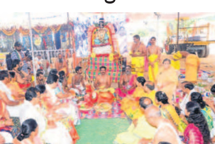
పూజల్లో పాల్గొన్న భక్తులు

కోదాండోస్, మార్చి 21 : పట్టణ ప్రధాన రహదారిపై నాగుబండి నగర్లో రామాలయ పునఃనిర్మాణంలో భాగంగా ఏర్పాటు చేసిన యాగశాలలో సోమవారం ప్రత్యేక పూజలు నిర్వహించారు. ఈ సందర్భంగా నిర్వహించిన శాస్త్ర సంఘ కార్యక్రమం అలరించింది. ఈ సందర్భంగా భక్తులకు అన్నదానం చేశారు. కార్య