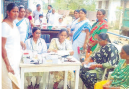
వేపలంబారంలో ప్రజలకు వైద్య పరీక్షలు నిర్వహిస్తున్న వైద్యాధికారిలు