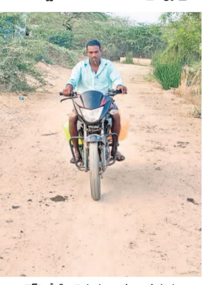
బైక్స్ నీటిని తెచ్చుకుంటున్న గ్రామస్థుడు

అయిజ రూరల్, మార్చి 18 : మండలంలోని సంకాపురం గ్రామంలో తాగు నీటి బోరుమోటర్ పాడవడంతో తాగునీటి కొరత ఏర్పడింది. దీంతో వారు గు రోజులుగా గ్రామస్థులు తీవ్ర ఇబ్బందులు పడుతున్నారు. సర్పంచల పడవీకాలం ముగియడంతో బోరు మరమ్మతును అధికారులు పట్టించుకోకపోవడంతో గ్రామస్థులే చందాలు వేసుకొని మోటర్ మరమ్మతులు చేయించుకునేందుకు సిద్ధమయ్యారు. ఈ మేరకు సోమవారం ఇంటింటికి తిరిగి ఇంటికి రూ.200 చొప్పున చందాలు వసూలు చేస్తున్నారు. ప్రస్తుత పరిస్థితిలో ప్రభుత్వం నుంచి నిధులు లేక అధికారులు సైతం మరమ్మతు పనులకు ఇబ్బందులు పడుతున్నారు. ఇప్పటికే ఎండలు అధికం కావడంతో తాగునీటి కోసం ప్రజలు తంటాలు పడుతున్నారు. గ్రామానికి మిషన్ భగీరథ వైప్లెట్ ఏర్పాటు చేసినా ప్రజలు ఫలితం లేకపోయింది. దీంతో బోరునీటితోనే ప్రజలు అవసరాలు తీర్చుకుంటున్నారు. పదిరోజుల కిందట బోరు మోటర్, స్ట్రాల్డర్ కాలిపోగా గ్రామంలోని ప్రజలు, యువకుల ద్వారా విరాళాలు సేకరించి