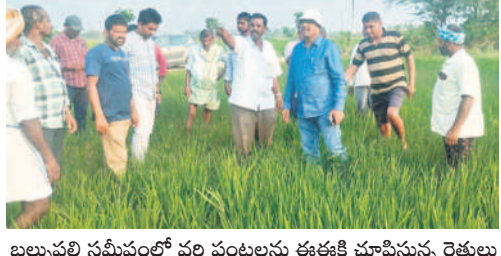
బల్యపల్లి సమీపంలో వరి పంటలను ఈకాకి చూపిస్తున్న రైతులు

కోయిల్ సాగర్ ఈకాతో రైతుల వాగ్దానం దేవరకల్ల, మార్చి 18 : మండలంలోని కోయిల్ సాగర్ కుడి కాల్వ అయకట్టుకు సాగునీరు విడుదల చేయాలని సోమవారం రైతులకు ప్రాజెక్ట్ వద్ద నిరసన వ్యక్తం చేశారు. అధికారులు ఎనిమిది రోజుల కిందట కుడి కాల్వ ద్వారా నీటిని విడుదల చేశారు. అయితే, బుద్ధవారం వరకు నీటిని విడుదల చేయాలి అంటూ ఎలాంటి సమాచారం ఇవ్వకుండా సోమవారం మధ్యాహ్నం నీటిని విడుదల చేశారు. దీంతో రైతులు ప్రాజెక్ట్ కార్యాలయానికి చేరుకొని ఈకా ప్రతాపింగితో వాగ్దానానికి దిగారు. ఈ విషయాన్ని రైతులు ఎమ్మెల్యే మధుసూదన్ రెడ్డి దృష్టికి తీసుకువెళ్లడంతో.. మంగళవారం నీటిని విడుదల చేయాలని ఈకాకి సూచించారు. కాగా, ఎమ్మెల్యే వద్ద సరే అని.. రైతులతో వదలమని చెప్పడంతో అగ్రహించిన రైతులు ఈకాని పట్టుబట్టి బల్యపల్లికి తీసుకువెళ్లి గ్రామంలో ఎండుతున్న పాల్వలు చూపించారు. దీంతో ఆయన మంగళవారం సాయంత్రం వరకు సాగునీరు విడుదల చేస్తామని హామీ ఇవ్వడంతో రైతులు శాంతించారు.