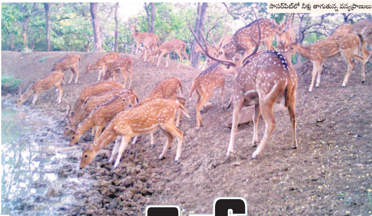
సానరీపిట్లలో నీళ్లు తాగుతున్న వన్యప్రాణులు