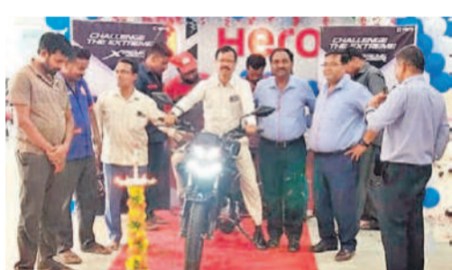
బైక్స్ విడుదల చేస్తున్న అభిమాని హీరో షోరూమ్ నేజర్లు

అమ్రాబాద్ ట్రైగర్ రిజర్వు ఫార్వర్డ్ ఫులుల సంఖ్య, మాంసాహార జంతువుల సంఖ్య గణనీయంగా పెరిగాయి. వన్యప్రాణులకు అహారం, నీటి కొరత లేకుండా అధికారులు జాగ్రత్తలు తీసుకుంటున్నారు. నల్లమల అటవీప్రాంతంలో జింకలు, దుప్పలు, అడవిపందులు, కుందేళ్లు ఇతర శాఖాహార జంతువులు అధికంగా ఉన్నాయి. వానకాలంలో అయితే అడవిలో ఎక్కడ పడితే అక్కడ నీళ్లు పుట్టులంగా ఉంటాయి. వన్యప్రాణులకు నీటి సమస్య ఉండదు. వేసవిలో ఎండ తీవ్రత అడవి అతకరాల్సి మైదానంగా కనిపిస్తుంది. నీటి వనరులైన కుంటలు, వాగులు ఎండిపోయాయి. దీంతో వన్యప్రాణులు నిత్యం నీళ్లు తాగి వనరులు ఎండిపోవడంతో నీళ్ల కోసం ఎరులకు వస్తుంటాయి. దీనివల్ల వన్యప్రాణులకు ప్రమాదం నెలకొంది. దీంతో అటవీశాఖ అధికారులు పర్యావారంలో ఉండే ప్రధాన నీటి వనరుల వన్యప్రాణులు ఎక్కడవో చర్యలు చేపట్టారు. వాగులు, కుంటల వద్ద సోలార్ బోర్డు వేసి వాటిని నింపుతున్నారు. దీంతో వన్యప్రాణులు నీళ్ల కోసం ఇబ్బందులు పడకుండా నిత్యం ఎక్కడ నీళ్లు తాగుతాయో అక్కడే నీటి సౌకర్యం కల్పించడం వల్ల జంతువులు బయటకు రావడానికి అవకాశం ఉండదని అధికారులు పేర్కొంటున్నారు.