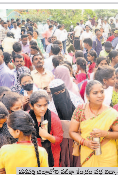
వసపల్లి జిల్లాలోని పరిక్లా కేంద్రం వద్ద విద్యార్థుల సందడి

మరమ్మతులు చేయించారు. వారు రోజులు పనిచేసిన మోటర్ మళ్ళీ కాలిపోయింది. దీంతో గ్రామస్థులు తీవ్ర ఇబ్బందులు పడుతున్నారు. ఈ నేపథ్యంలో తిరిగి రెండో సారి గ్రామంలో ఇంటింటికి తిరిగి రూ. 200 చొప్పున చందాలు వసూలు చేస్తున్నారు. కొంత మంది వేదవారు డబ్బులు ఇచ్చేందుకు ఇబ్బంది పడుతూ అధికారులపై ఆగ్రహం వ్యక్తం చేస్తున్నారు. మూడు రోజులుగా గ్రామంలో తాగునీటి సరఫరా లేకపోవడంతో గ్రామ శివారులోని వ్యవసాయ బోర్డును ఆశ్రయిస్తూ ప్రజలు ఇక్కట్లకు గురవుతున్నారు. వేసవి దృష్ట్యా రైతులు సైతం గ్రామస్థులకు తాగునీరు ఇచ్చేందుకు ససేమిలా అంటున్నారు. ఉన్నతాధికారులు దృష్టి కేంద్రీకరించి తాగునీటి సమస్యను పరిష్కరించాలని గ్రామస్థులు కోరుతున్నారు. ఈ విషయమై సోమవారం పంచాయతీ కార్యదర్శిని కలిసి ఆరా తీయగా ప్రభుత్వం నుంచి నిధులు మంజూరు కాలేదని తెలిపారు.