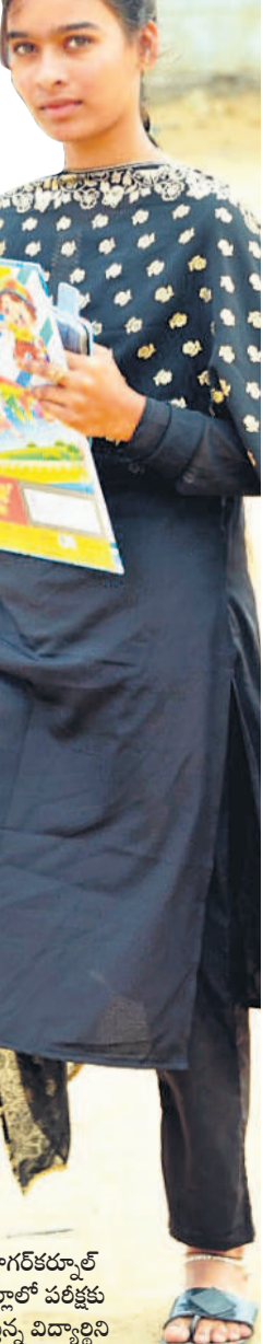
నాగర్ కర్నూల్ జిల్లాలో పరిక్లకు వెళ్తున్న విద్యార్థిని