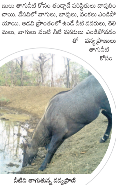
నీటిని తాగుతున్న వన్యప్రాణి

అచ్చంపేట, మార్చి 18 : అమ్రాబాద్ ట్రైగర్ రిజర్వు అనేక జీవ జాతులు, వృక్షాలు, జంతుజాలంతో గొప్ప జీవ వైవిధ్యాన్ని కలిగి ఉన్నది. ఈ ప్రాంతం పులులకు నిలయం. లోతైన రోయలు, కనుమలు కలిగిన నల్లమల ట్రైగర్ రిజర్వులో కొండ భూభాగం కృష్ణానది పరీవాహక ప్రాంతంగా ఉన్నది. నల్లమల అటవీ ప్రాంతం 2,611.4 చదరపు కిలోమీటర్ల విస్తీర్ణంలో ఉంది. దట్టమైన అడవిలోని వన్యప్రాణులు తాగునీటి కోసం తండ్లాడే పరిస్థితులు దాపురించాయి. వేసవిలో వాగులు, బావులు, వంకలు ఎండిపోయాయి. అడవి ప్రాంతంలో ఉండే నీటి వనరులు, చెలిమెలు, వాగులు వంటి నీటి వనరులు ఎండిపోవడంతో వన్యప్రాణులు తాగునీటి కోసం