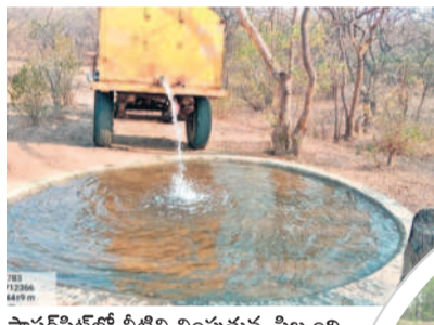
సానరీపిట్లలో నీటిని నింపుతున్న సిబ్బంది

అచ్చంపేట, మార్చి 18 : అమ్రాబాద్ ట్రైగర్ రిజర్వు అనేక జీవ జాతులు, వృక్షాలు, జంతుజాలంతో గొప్ప జీవ వైవిధ్యాన్ని కలిగి ఉన్నది. ఈ ప్రాంతం పులులకు నిలయం. లోతైన రోయలు, కనుమలు కలిగిన నల్లమల ట్రైగర్ రిజర్వులో కొండ భూభాగం కృష్ణానది పరీవాహక ప్రాంతంగా ఉన్నది. నల్లమల అటవీ ప్రాంతం 2,611.4 చదరపు కిలోమీటర్ల విస్తీర్ణంలో ఉంది. దట్టమైన అడవిలోని వన్యప్రాణులు తాగునీటి కోసం తండ్లాడే పరిస్థితులు దాపురించాయి. వేసవిలో వాగులు, బావులు, వంకలు ఎండిపోయాయి. అడవి ప్రాంతంలో ఉండే నీటి వనరులు, చెలిమెలు, వాగులు వంటి నీటి వనరులు ఎండిపోవడంతో వన్యప్రాణులు తాగునీటి కోసం