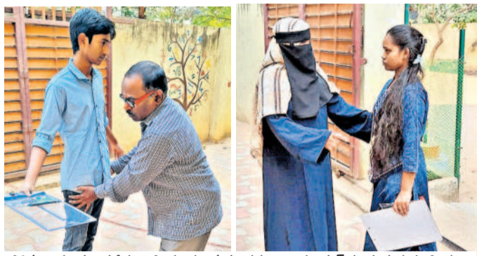
సోమవారం పది పరీక్షలు ప్రారంభమైన సందర్భంగా యూసుఫ్ నగర్ ప్రభుత్వ పాఠశాల వద్ద విద్యార్థులను తనిఖీలు చేసే పంపుతున్న ఉపాధ్యాయులు. -జూబ్లీహిల్స్