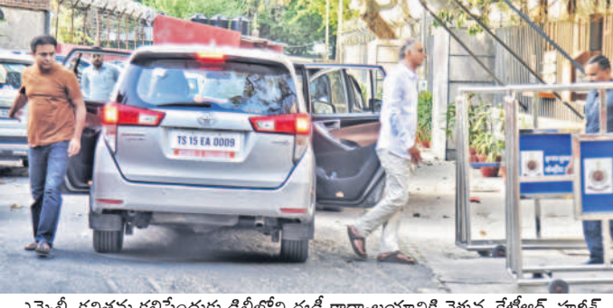
ఎమ్మెల్సీ కవితను కలిసేందుకు ఢిల్లీలోని ఈ డి.కార్యాలయంలో వెళ్తున్న కేటీఆర్, హల్దీ