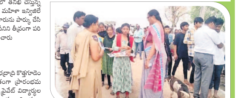
ఇల్లెందుల రూరల్ : విద్యార్థులను తనిఖీ చేస్తున్న ఉపాధ్యాయులు