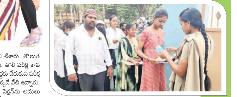
కొత్తగూడెం ఎదుకేపేట్ : విద్యార్థులను పరిశీలించి కేంద్రంలోకి అనుమతిస్తున్న పోలీస్ సిబ్బంది