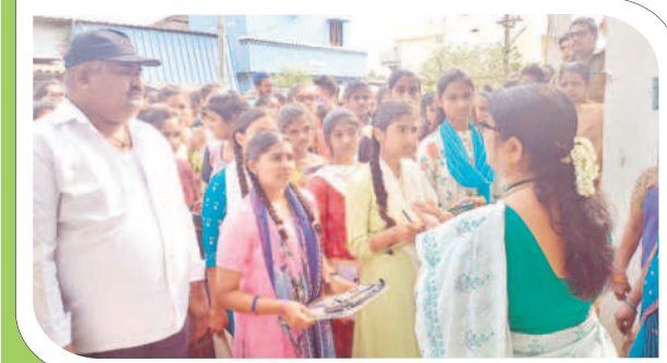
సత్తుపల్లి : పరిశీలన కేంద్రంలోనికి వెళ్తున్న విద్యార్థులు