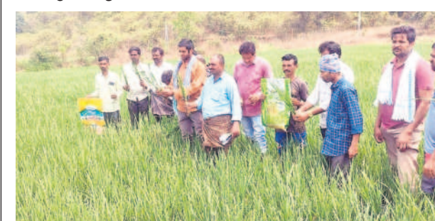
పంటను చూపిస్తున్న రైతులు

ఇల్లెందుల రూరల్, మార్చి 18: రెక్కలు ముక్కలు చేసుకుని, అప్పో సపో చేసి పరిసారం చేస్తున్నామని, తీరా సారం ప్రాంతంలోని పైని ఎడగడం లేదని, డీలర్ల నకిలీ విత్తనాలు అంటుంటుండడంతోనే ఈ పరిస్థితి దాపురించిందని మండలానికి చెందిన పలువురు రైతులు ఆందోళన వ్యక్తం చేశారు. ఈ మేరకు మీడియాకు వివరాలు వెల్లడించారు. కొమారం, బోయంతూడ, పోచారం, పోలారంతో పాటు పలు గ్రామాలకు చెందిన రైతులు సుమారు 50 ఎకరాల్లో పరిసారం చేస్తున్నారు. మొదట్లో వైరు బాగానే ఉన్నప్పటికీ రెండు నెలల కర్మాగ్రామ ప్రాథమిక దశలోనే పక్కానికీ రావడం, ఎదుగుదల లేకపోవడం, కాండాలు దృఢం కాకపోవడం వల్ల గమనించారు. డీలర్లు ఇచ్చిన నకిలీ విత్తనాలతోనే ఈ పరిస్థితి వచ్చిందని నిర్ధారించుకుని సోమవారం మూకుమ్మడిగా మీడియాకు గోడు వెల్లడించారు. ఒక్కో ఎకరానికి సుమారు రూ.30 వేల డొలార్లను అప్పులు తెచ్చి పెట్టుకుని, ప్రస్తుతం పంట చేతికొచ్చే పరిస్థితి లేదని ఆవేదన వ్యక్తం చేశారు. వెంటనే నకిలీ విత్తనాలు అంటుంటున్న డీలర్లపై రాష్ట్ర ప్రభుత్వం చర్యలు తీసుకోవాలని, అలాగే తమకు న్యాయం చేయాలని రైతులు డిమాండ్ చేస్తున్నారు. దీనిపై 'నమస్తే ఏవో సత్కర్మ వివరణ కోరగా.. డీలర్లు నకిలీ విత్తనాలు అంటుంటున్నారని రైతులు మాకు ఫిర్యాదు చేశారు. ఆయన దుకాణాల యాజమాన్యాలకు ఇప్పటికే నోటీసులు ఇచ్చాం. రైతుల నుంచి విత్తనాలు సేకరించి వాటిని ల్యాబ్ కు పంపించాం. విత్తనాలు నకిలీ అని తెలితే డీలర్లపై చర్యలు తీసుకుంటాం.. ' అని సమాధానమిచ్చారు.