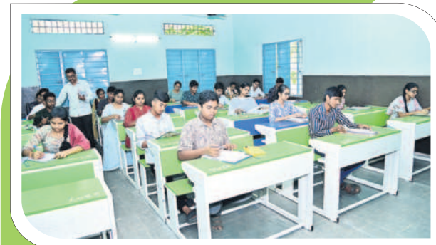
ఖమ్మంలోని ఎన్ఎస్సీ క్యాంపు ప్రభుత్వ పాఠశాలలో పరిశీలన విద్యార్థులు