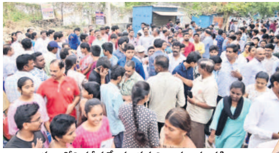
ఖమ్మంలోని పరిశీలన కేంద్రం వద్ద విద్యార్థుల సందడి

తొలి వార్షిక పరీక్ష కావడంతో విద్యార్థులు తమకు ఇష్టమైన పూజలు చేయడంతో పాటు తమ హాల్ టెక్నిక్ల సైతం ప్రత్యేక పూజలు చేయించుకొని పరీక్ష కేంద్రాలకు చేరుకున్నారు. జిల్లాలో 97 పరీక్ష కేంద్రాల్లో పరీక్షలు నిర్వహించారు. తొలిరోజు తెలుగు పరీక్ష మొత్తం 16,582 మంది విద్యార్థులకుగాను 18,543 మంది హాజరయ్యారు. 39 మంది విద్యార్థులు గైర్హాజరయ్యారు. 99.76 శాతం హాజరు నమోదైనట్లు డీఈవో సోమవారం తెలిపారు. ప్రైవేట్లో 58 మంది విద్యార్థులకు గాను 46 మంది హాజరై 12 మంది గైర్హాజరయ్యారు.