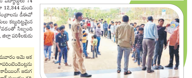
పాల్యంపేట రూరల్ : కిన్నెరసానిలో పరిశీలన కేంద్రానికి వెళ్తున్న విద్యార్థులు