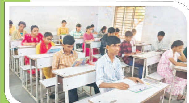
వైరాటోన్ : పరిశీలన కేంద్రాన్ని విద్యార్థులు