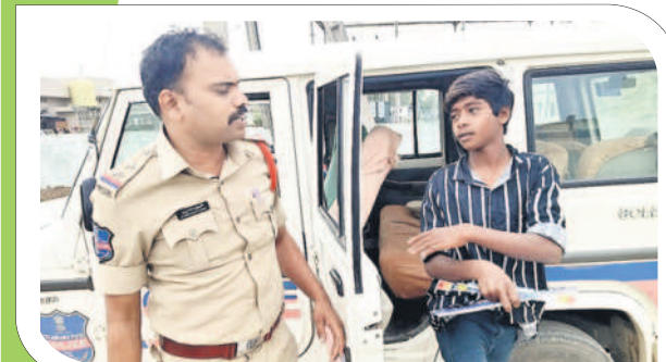
కొత్తగూడెం ఎదుకేపేట్ : తన వాహనంలో ఓ విద్యార్థిని కేంద్రానికి తీసుకొచ్చిన ఎస్సీ