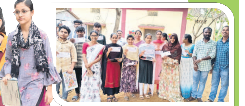
అశ్వారావుపేట టౌన్ : హాల్ టెక్నిక్ చూపిస్తున్న విద్యార్థులు