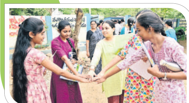
ఖమ్మంలో ఆర్ బి టెన్స్ చెప్పకుంటున్న విద్యార్థులు