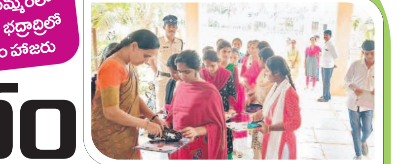
అన్నపూర్ణపల్లి : విద్యార్థులను తనిఖీ చేస్తున్న ఉపాధ్యాయ సిబ్బంది