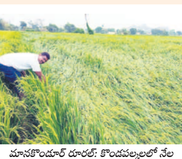
మానకొండూర్ దూరలో కొండవల్లలో నేల కొరిగిన వరి పంట

వడగళ్ల వర్షం రైతులపై పగబట్టింది. శనివారం రాత్రి పెద్ద పెద్ద రాళ్లతో కూడిన వర్షం పంటలను ధ్వంసం చేసింది. గంభీరాపుపేట, మున్నూర్, వీరప్పల్లి, సిరి సిల్లా పట్టణంలో భారీ వర్షం కురిసింది. రెండు గంటల పాటు ఏకదాటిగా కురిసిన వర్షానికి భారీగా పంట నష్టం జరిగింది. వ్యవసాయ శాఖ ప్రాథమిక అంచనాల ప్రకారం జిల్లాలో 500 ఎకరాల్లో వరి పంట నష్టం జరిగినట్లు అధికారులు తెలిపారు. అత్యధికంగా గంభీరాపుపేట మండలంలోనే ఎక్కువ జరిగింది. ఇప్పటి వరకు తెలిసిన సమాచారం ప్రకారం 350 ఎకరా వరి నష్టం జరిగినట్లు చెబుతుండగా, వండలూరి ఎకరాల వరి, మామిడి తోటలు నష్టం జరిగి అవకాశం ఉందని తెలుస్తున్నది. ఇక వీరప్పల్లి మండలంలో 58, మున్నూర్ మండలంలో 28 ఎకరాల్లో వరి నష్టం జరిగినట్లు ప్రాథమిక అంచనా వేసింది. ఇంకా వ్యవసాయ శాఖ ఇంకా సర్వే జరుపుతున్నది. గంభీరాపుపేట మండలంలో దాదాపు 400 మంది రైతులకు సంబంధించి వెయ్యి ఎకరాల వరకు నష్టం జరిగినట్లు రైతులు తెలిపారు. వీరప్పల్లి మండలం కేంద్రంలో పంటల నష్టం, శాంతినగర్, లాల్ గోవింద్, రంగంపేట, గ్రామాల్లో వరి దెబ్బతిన్నది. మామిడి తోటలు నేలమట్టమయ్యాయి. ప్రభుత్వం ఆదుకోవాలని రైతులు కోరుతున్నారు.