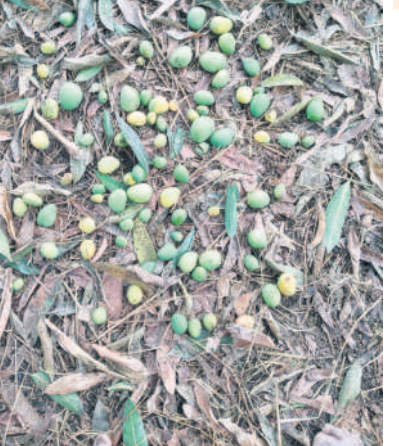
మానకొండూర్ దూరలో నేలరానిన మామిడి కాాయలు

వడగళ్ల వర్షం రైతులపై పగబట్టింది. శనివారం రాత్రి పెద్ద పెద్ద రాళ్లతో కూడిన వర్షం పంటలను ధ్వంసం చేసింది. గంభీరాపుపేట, మున్నూర్, వీరప్పల్లి, సిరి సిల్లా పట్టణంలో భారీ వర్షం కురిసింది. రెండు గంటల పాటు ఏకదాటిగా కురిసిన వర్షానికి భారీగా పంట నష్టం జరిగింది. వ్యవసాయ శాఖ ప్రాథమిక అంచనాల ప్రకారం జిల్లాలో 500 ఎకరాల్లో వరి పంట నష్టం జరిగినట్లు అధికారులు తెలిపారు. అత్యధికంగా గంభీరాపుపేట మండలంలోనే ఎక్కువ జరిగింది. ఇప్పటి వరకు తెలిసిన సమాచారం ప్రకారం 350 ఎకరా వరి నష్టం జరిగినట్లు చెబుతుండగా, వండలూరి ఎకరాల వరి, మామిడి తోటలు నష్టం జరిగి అవకాశం ఉందని తెలుస్తున్నది. ఇక వీరప్పల్లి మండలంలో 58, మున్నూర్ మండలంలో 28 ఎకరాల్లో వరి నష్టం జరిగినట్లు ప్రాథమిక అంచనా వేసింది. ఇంకా వ్యవసాయ శాఖ ఇంకా సర్వే జరుపుతున్నది. గంభీరాపుపేట మండలంలో దాదాపు 400 మంది రైతులకు సంబంధించి వెయ్యి ఎకరాల వరకు నష్టం జరిగినట్లు రైతులు తెలిపారు. వీరప్పల్లి మండలం కేంద్రంలో పంటల నష్టం, శాంతినగర్, లాల్ గోవింద్, రంగంపేట, గ్రామాల్లో వరి దెబ్బతిన్నది. మామిడి తోటలు నేలమట్టమయ్యాయి. ప్రభుత్వం ఆదుకోవాలని రైతులు కోరుతున్నారు.