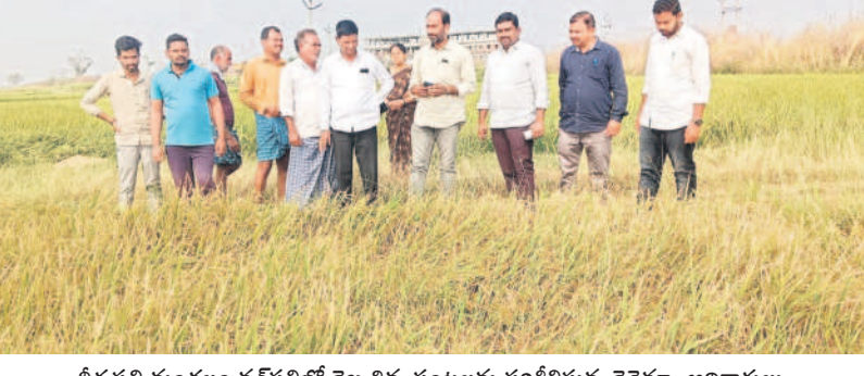
వీరప్పల్లి మండలం వనపల్లిలో దెబ్బతిన్న పంటలను పరిశీలిస్తున్న రెవెన్యూ అధికారులు