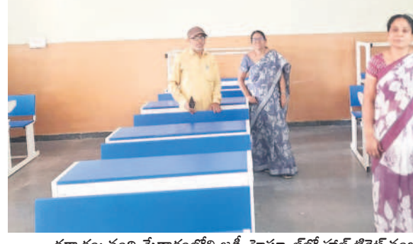
ధర్మారం: నంది మేడారంలోని జడ్పీ హాలులో హాల్ టెలికే సబంధ వేస్తున్న నిర్మాణం

తెలంగాణవోక్, మార్చి 17: 'పది' పబ్లిక్ పరీక్షలకు సర్వం సిద్దమైంది. నేటి నుంచి వచ్చే నెల 2వ తేదీ వరకు జరుగనున్న ఏకాగ్రామ అధికార యంత్రాంగం అన్ని ఏర్పాట్లు చేసింది. ఉమ్మడి కరీంనగర్ జిల్లా వ్యాప్తంగా 219 కేంద్రాల ఏర్పాటు చేయగా, మొత్తం 38,097 మంది పరీక్షలు రాయనున్నారు. ఉదయం 9:30 నుంచి మధ్యాహ్నం 12:30 గంటల వరకు పరీక్షా సమయం కాగా, గంటల మొదటి చేరుకోవాలని విద్యార్థుల అధికారులు సూచిస్తున్నారు. కాగా, పరీక్షల నిర్వహణలో ఎలాంటి అప్రకటనలు, లోపాలు లేకుండా ఉండేందుకు ఉన్నతాధికారులు ప్రత్యేక శ్రద్ధ తీసుకుంటున్నారు. విద్యార్థులు ఒక్క రులు అధిగమిస్తే.. విజయం అత్యధిపని పలు సూచనలు చేస్తూనే, మానీ కామియంగ్కు పాలిటాడినా, ప్రోత్సహించినా కలిసే చర్యలు తప్పవని హెచ్చరించారు.