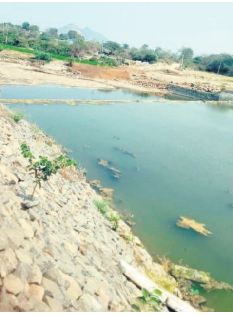
ఎండిపోయిన బిల్వాకోడూర్ వాగు