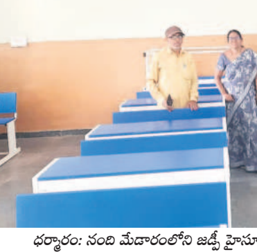
ధర్వారం: నంది మేడారంలోని జడ్పీ హౌస్లో హాల్ టెలికే సబబుల్ల వేస్తున్న సిబ్బంది