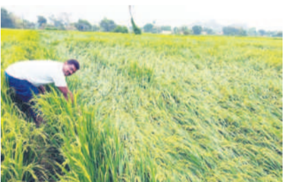
మానకొండలో రూరల్: కొండవల్లలో నెలరాలిన వరి పంట

వడగళ్ల వర్షం రైతులపై పగబట్టింది. శనివారం రాత్రి పెద్ద పెద్ద రాళ్లతో కూడిన వర్షం పంటలను ధ్వంసం చేసింది. గంటారావుపేట, మున్నూరుపాళె, వీర్వపల్లి, సిరిసిల్ల పట్టణంలో భారీ వర్షం కురిసింది. రెండు గంటల పాటు ఏకదాటిగా కురిసిన వర్షానికి భారీగా పంట నష్టం జరిగింది. వ్యవసాయ శాఖ ప్రాథమిక అంచనాల ప్రకారం జిల్లాలో 500 ఎకరాల్లో వరి పంట నష్టం జరిగినట్లు అధికారులు తెలిపారు. అత్యధికంగా పంటల నష్టం గంటీరావుపేట మండలంలోనే ఎక్కువ జరిగింది. ఇప్పటి వరకు తెలిసిన సమాచారం ప్రకారం 350 ఎకరా వరి నష్టం జరిగినట్లు చెబుతుండగా, వందలాది ఎకరాల వరి, మామిడి తోటలు నష్టం జరిగి అవకాశం ఉందని తెలుస్తున్నది. ఇక వీర్వపల్లి మండలంలో 58, మున్నూరుపాళె మండలంలో 28 ఎకరాల్లో వరి నష్టం జరిగినట్లు ప్రాథమిక అంచనా వేసింది. ఇంకా వ్యవసాయ శాఖ ఇంకా సర్వే జరుపుతున్నది. గంటీరావుపేట మండలంలో దాదాపు 400 మంది రైతులకు సంబంధించి వెయ్యి ఎకరాల వరకు నష్టం జరిగినట్లు తెలుస్తుంది. వీర్వపల్లి మండలం కేంద్రంలో పంటల నష్టం, శాంతినగర్, లాల్ గోన్డి కండా, రంగంపేట, గ్రామాల్లో వరి దెబ్బతిన్నది. మామిడి తోటలు నెలరలు ట్టుమయ్యాయి. ప్రభుత్వం ఆదుకోవాలని రైతులు కోరుతున్నారు.