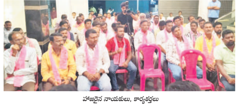
హాజరైన నాయకులు, కార్యకర్తలు