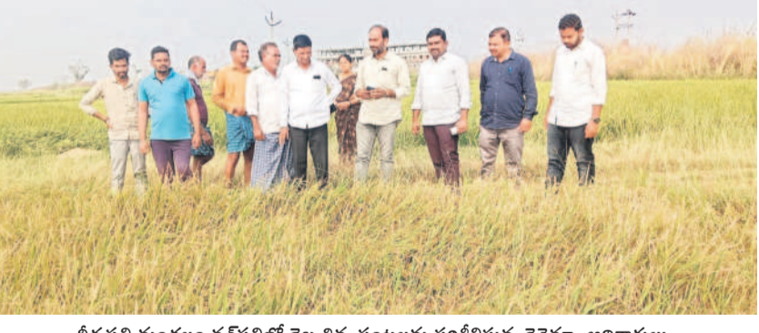
వీర్వపల్లి మండలం వన్ పల్లిలో దెబ్బతినే పంటలను పరిశీలిస్తున్న రైతుసభ్యు అధికారులు

సిరిసిల్లలో అత్యధికంగా పంట నష్టం రాజన్న సిరిసిల్ల జిల్లాలో వడగళ్ల వర్షం ఆస్తిదాతలను నిండా ముంచింది. ప్రాథమికంగా అందిన సమాచారం మేరకు 500 ఎకరాల నష్టం జరిగినట్లు తెలుస్తున్నది. జిల్లా వ్యాప్తంగా 13 మండలాల్లో 1.83లక్షల ఎకరాల్లో యాసంగి పంటలు సాగు చేశారు. అందులో వరి 1,73,100, మక్క 1014, నువ్వులు 240 ఎకరాలు, పొద్దుతిరుగుడు 308, శనగ 392, ఆయిల్ సాం 687, కూరగాయలు 550, పండవోలు 5,467, ఉడ్డాన పంటలు 6,817 ఎకరాల్లో సాగు చేశారు. మరో పదిహేను రోజుల్లో పంట చేతికొస్తుందనుకుంటే