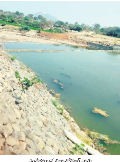
ఎండిపోయిన విల్వకొడూర్ వాగు

గొల్లపల్లి, మార్చి 17 : గొల్లపల్లి మండలంలో సాగునీటి కటకట మొదలైంది. ముఖ్యంగా విల్వకొడూర్ వాగును సమస్యకొని పంటలు సాగు చేసిన విల్వకొడూర్, దట్పూర్, ఆబూపూర్ లోని సుమారు 150 మంది రైతుల పరిస్థితి అగమ్యగోచరంగా మారింది. ఈ మూడు గ్రామాల వాగొడ్డు రైతులు ఏటా 400 ఎకరాల్లో వరి పండిస్తున్నారు. ఎన్నారెన్నో నుంచి వారందరి పద్ధతిన విడుదలయ్యే నీరు రంగధాము నున్న రిజర్వాయర్లోకి చేరి మత్తడి దూకే విల్వకొడూర్ వాగు ప్రవహిస్తుంది. ఆ జలాల్లో వీరికి ఆధారం. వాగు నీటి ప్రవాహానికి కరెంట్ మోటార్లు పెట్టకుని సాగు చేస్తుంటారు. ఇలా పడేండ్లుగా ఏ బాధా లేకుండా పంటలు పండించుకున్నారు. ఈ యాసంగిలోనూ అలానే నీళ్లు వస్తాయని భావించి పంటలు విసకున్నారు. కానీ, ఎన్నారెన్నో నుంచి వారి పద్ధతిన నీరు సక్రమంగా రాకపోవడంతో రంగధాముని పల్లి రిజర్వాయర్ నిండలేదు. అలుగుపారేకుడు. దీంతో వాగులో చుక్కల నీరు లేక రైతులు అరిగోసపడుతున్నారు. పంటలు చేతికొందే చదలే ఉన్నాయని, మరో నాలుగు తడులు అందితేనే దక్కుతాయని, లేదంటే ఎండిపోవడం ఖాయమని వాపోతున్నారు. ఇప్పటికే చాలా వరకు పంటలు నెలెలు బారాయని, మరో పదిరోజులు నీరండడంటే పశువుల మేతకు పదిలేయాల్సి వస్తుంది అందోళన చెందుతున్నారు. ఇప్పటికైనా సాగునీటి అవసరాలు సుగంధించి రంగధామునిపల్లి రిజర్వాయర్ ను పూర్తిస్థాయిలో నింపి, నీరందించాలని వేడుకుంటున్నారు.