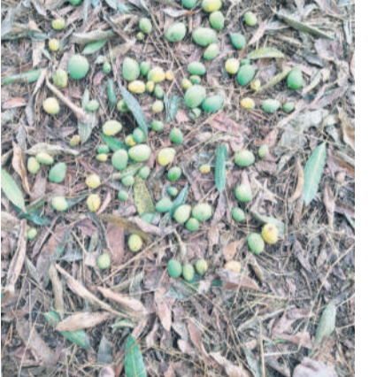
మానకొండలో రూరల్ నెలరాలిన మామిడి కాదయి

రాజన్న సిరిసిల్ల, మార్చి 17 (నమస్తే తెలంగాణ): అకాల వర్షం రైతులకు తీరని నష్టాన్ని తెచ్చింది. శనివారం రాత్రి కరీంనగర్ ఉమ్మడి జిల్లాలో గాలివాన బీభత్సం సృష్టించింది. దాదాపు రెండు గంటలపాటు కడరూరగాలులతో కూడిన వడగళ్ల వాన అతలాకుతలం చేసింది. ముఖ్యంగా మామిడి నాలుగు మండలాల్లో వరి, మక్క, కూరగాయల తోటలు దెబ్బతినగా, మామిడి పిండెలు నెలరాలాయి. రైతుల్లో ఆలస ముంచాయి.