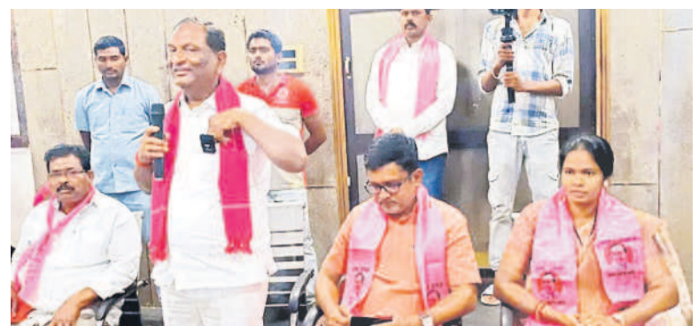
మంధనిలో మాట్లాడుతున్న కొద్దుల ఈశ్వర్ పక్కన జడ్పీ చైర్మన్ పుట్ల మధుకర్