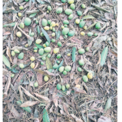
మానకొండూర్ దూరలో: నెలరాలిన మామిడి కాదయి

రాజన్న సిరిసిల్ల, మార్చి 17 (నమస్తే తెలంగాణ): అకాల వర్షం రైతులకు తీరని నష్టాన్ని తెచ్చింది. శనివారం రాత్రి కరీంనగర్ ఉమ్మడి జిల్లాలో గాలివాన బీభత్సం సృష్టించింది. దాదాపు రెండు గంటలపాటు కేవలంగాలతో కూడిన వడగళ్ల వాన అతలాకుతలం చేసింది. ముఖ్యంగా మామిడి నాలుగు మండలాల్లో వరి, మక్క, కూరగాయల తోటలు దెబ్బతినగా, మామిడి పిండెలు నెలరాలాయి. రైతుల్లో ఆలస ముంచాయి.