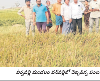
వీరపల్లి మండలం వనపల్లిలో దెబ్బతినే పంటలను పరిశీలిస్తున్న రెవెన్యూ అధికారులు

సిరిసిల్లలో అత్యధికంగా పంట నష్టం రాజన్న సిరిసిల్ల జిల్లాలో వడగడ్ల వర్షం అన్నదాతలను నిండా ముంచింది. ప్రాథమికంగా అందిన సమాచారం మేరకు 500 ఎకరాల నష్టం జరిగినట్లు తెలుస్తున్నది. జిల్లా వ్యాప్తంగా 13 మండలాల్లో 1.83లక్షల ఎకరాల్లో యాసంగి పంటలు సాగు చేశారు. అందులో వరి 1,73,100, మక్క 1014, నువ్వులు 240 ఎకరాలు, పొద్దుతిరుగుడు 308, శనగ 392, ఆంతుకాం 687, కూరగాయలు 550, పండ్లతోటలు 5,467, ఉద్యాన పంటలు 6,817 ఎకరాలలో సాగు చేశారు. మరో పదిహేను రోజుల్లో పంట చేతికొస్తుందనుకుంటే