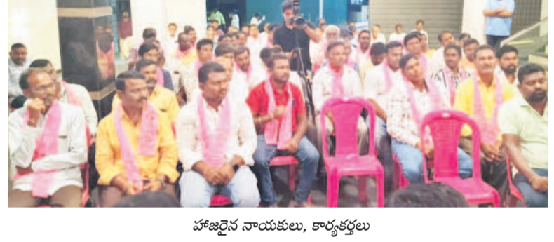
హాజరైన నాయకులు, కార్యకర్తలు