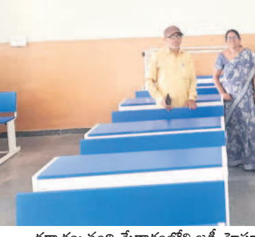
ధర్మారం: నంది మేడారంలోని జడ్పీ హౌస్ లో హాల్ టెలికా సబ్సిడీ వేస్తున్న నిర్మాణం

రులు ప్రత్యేక శ్రద్ధ తీసుకుంటున్నారు. విద్యార్థులు ఒక్కో రోజు అధికమన్నే.. విజయం తీరేవరకు పలు సూచనలు చేస్తున్నా, మాన కామింగ్ కు పాల్పడినా, ప్రోత్సహించినా కఠిన చర్యలు తప్పవని హెచ్చరించారు.