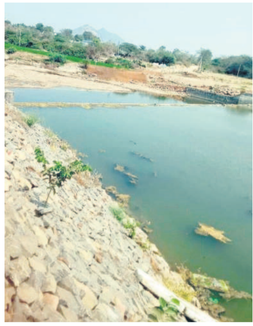
ఎండిపోయిన బిల్వకోడూర్ వాగు

5 కరీంనగర్, సోమవారం 18 మార్చి 2024 JAGTIAL