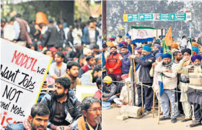
ప్రస్తున్న చేసుకునేందుకు ప్రయత్నిస్తున్నది.

లోక్ సభ ఎన్నికలపై ధరలు, రైతుల కష్టాలు, నిరుద్యోగం ప్రభావం