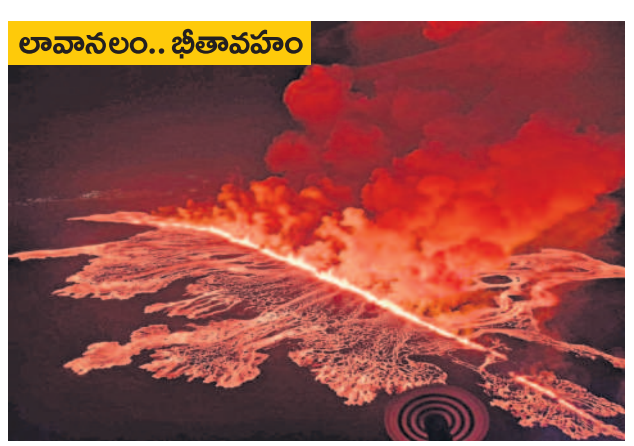
లావానలం.. భీతివహం చూడగానే లబ్ధి రహస్యం ఒక లగ్ని వ్యవస్థ వినిపిస్తోంది. పశ్చిమ బెంగాల్ లోని గ్రీం డెట్ పట్టణ శివాలిలో లగ్ని వ్యవస్థం బద్దలై ఇలా నిప్పులు చిమ్ము తున్నది. లగ్ని వ్యవస్థం నుంచి ఎల్లరే లావా పోగులు కలుగుతూ ప్రమాదాన్ని సృష్టిస్తుంది. బెంగాల్ లోని గ్రీం డెట్ పట్టణ శివాలిలో లగ్ని వ్యవస్థం బద్దలై ఇలా నిప్పులు చిమ్ము తున్నది.