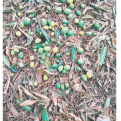
మానకొండూర్ ధూరల్: నేలరాల్సిన మామిడి కాంబలు

వడగళ్ల వర్షం రైతులపై పగబట్టింది. శనివారం రాత్రి పెద్ద పెద్ద రాళ్లతో కూడిన వర్షం పంటలను ధ్వంసం చేసింది. గంభీరాపుపేట, మున్నూర్, వీరపల్లి, సిరి సిల్ల పట్టణంలో భారీ వర్షం కురిసింది. రెండు గంటల పాటు ఏకదాటిగా కురిసిన వర్షానికి భారీగా పంట నష్టం జరిగింది. వ్యవసాయ శాఖ ప్రాథమిక అంచనాల ప్రకారం జిల్లాలో 500 ఎకరాల్లో వరి పంట నష్టం జరి గినట్లు అధికారులు తెలిపారు. అత్యధికంగా అందులో గంభీరాపుపేట మండలంలోనే ఎక్కువ జరిగింది. ఇప్పటి వరకు తెలిసిన సమాచారం ప్రకారం 350 ఎక రా వరి నష్టం జరిగినట్లు చెబుతుండగా, వందలాది ఎకరాల వరి, మామిడి తోటలు నష్టం జరిగే అవకాశం ఉందని తెలుస్తున్నది. ఇక వీరపల్లి మండలంలో 58, మున్నూర్ మండలంలో 28 ఎకరాల్లో వరి నష్టం జరి గినట్లు ప్రాథమిక అంచనా వేసింది. ఇంకా వ్యవసాయ శాఖ ఇంకా సర్వే జరుపుతున్నది. గంభీరాపుపేట మండలంలో ధాదాపు 400 మంది రైతులకు సంబం ధించి వెయ్యి ఎకరాల వరకు నష్టం జరిగినట్లు రైతులు తెలిపారు. వీరపల్లి మండలం కేంద్రంలో పాటు వనపల్లి, శాంతినగర్, లాల్ గిరిగో కండా, రంగంపేట, గ్రామాల్లో వరి దెబ్బతిన్నది. మామిడి తోటలు నేలమ ట్టమయ్యాయి. ప్రభుత్వం అడుకోవాలని రైతులు కోరు తున్నారు.