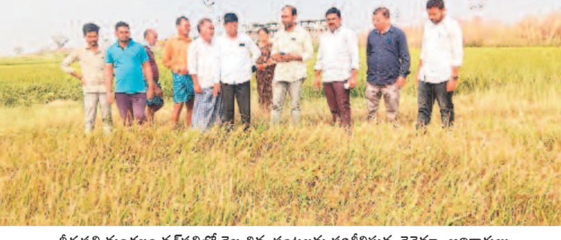
వీరపల్లి మండలం వనపల్లిలో దెబ్బతిన్న పంటలను పరిశీలిస్తున్న రెవెన్యూ అధికారులు

రాజసు సిరిసిల్ల జిల్లాలో వడగడ్ల వర్షం అన్నదాత లను నిండా ముంచింది. ప్రాథమికంగా అందిన సమా చారం మేరకు 500 ఎకరాల నష్టం జరిగినట్లు తెలుస్తు న్నది. జిల్లా వ్యాప్తంగా 13 మండలాల్లో 1.83లక్షల ఎకరాల్లో యాసంగి పంటలు సాగు చేశారు. అందులో వరి 1,73,100, మక్క 1014, నువ్వులు 240 ఎక రాలు, పొద్దుతిరుగుడు 308, శనగ 392, ఆంబల్ ఫాం 687, కూరగాయలు 550, పండ్లతోటలు 5,467, ఉద్యాన పంటలు 6,317 ఎకరాలలో సాగు చేశారు. మరో పదిహేను రోజుల్లో పంట చేతికొస్తుందనుకుంటే