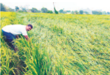
మానకొండూర్ ధూరల్: కొండవల్లలో నేల కొరిగిన వరి పంట

వడగళ్ల వర్షం రైతులపై పగబట్టింది. శనివారం రాత్రి పెద్ద పెద్ద రాళ్లతో కూడిన వర్షం పంటలను ధ్వంసం చేసింది. గంభీరాపుపేట, మున్నూర్, వీరపల్లి, సిరి సిల్ల పట్టణంలో భారీ వర్షం కురిసింది. రెండు గంటల పాటు ఏకదాటిగా కురిసిన వర్షానికి భారీగా పంట నష్టం జరిగింది. వ్యవసాయ శాఖ ప్రాథమిక అంచనాల ప్రకారం జిల్లాలో 500 ఎకరాల్లో వరి పంట నష్టం జరి గినట్లు అధికారులు తెలిపారు. అత్యధికంగా అందులో గంభీరాపుపేట మండలంలోనే ఎక్కువ జరిగింది. ఇప్పటి వరకు తెలిసిన సమాచారం ప్రకారం 350 ఎక రా వరి నష్టం జరిగినట్లు చెబుతుండగా, వందలాది ఎకరాల వరి, మామిడి తోటలు నష్టం జరిగే అవకాశం ఉందని తెలుస్తున్నది. ఇక వీరపల్లి మండలంలో 58, మున్నూర్ మండలంలో 28 ఎకరాల్లో వరి నష్టం జరి గినట్లు ప్రాథమిక అంచనా వేసింది. ఇంకా వ్యవసాయ శాఖ ఇంకా సర్వే జరుపుతున్నది. గంభీరాపుపేట మండలంలో ధాదాపు 400 మంది రైతులకు సంబం ధించి వెయ్యి ఎకరాల వరకు నష్టం జరిగినట్లు రైతులు తెలిపారు. వీరపల్లి మండలం కేంద్రంలో పాటు వనపల్లి, శాంతినగర్, లాల్ గిరిగో కండా, రంగంపేట, గ్రామాల్లో వరి దెబ్బతిన్నది. మామిడి తోటలు నేలమ ట్టమయ్యాయి. ప్రభుత్వం అడుకోవాలని రైతులు కోరు తున్నారు.