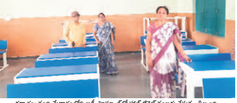
ధర్మారం: నంది మేడారంలోని జడ్పీ హౌస్ లో హాల్ టెలికాన్ బండ్ల వేస్తున్న నిర్మాణి