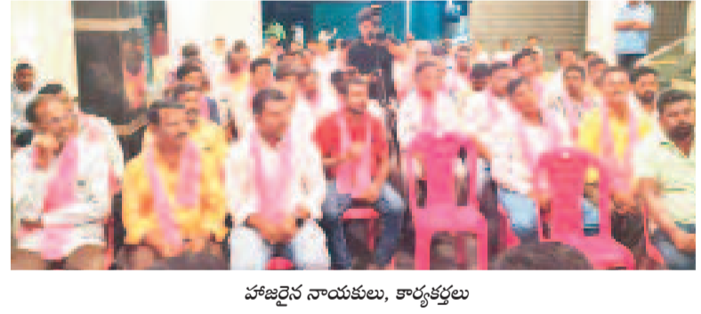
హాజరైన నాయకులు, కార్యకర్తలు