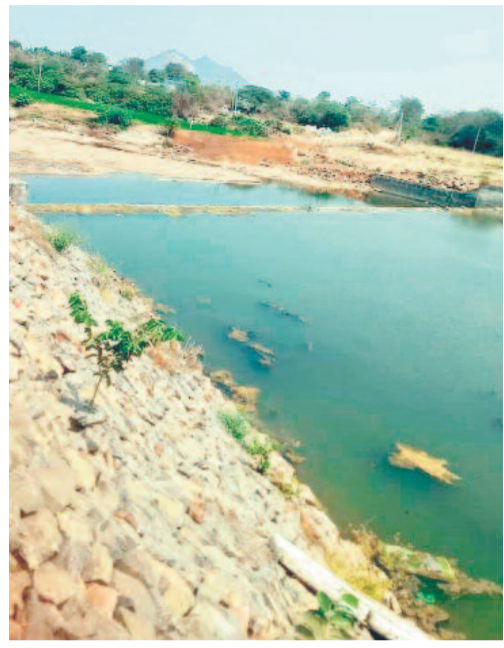
ఎండిపోయిన బిల్వకోడూర్ వాగు