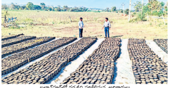
బాన్సపూర్లో నర్సరీని పరిశీలిస్తున్న అధికారులు

నార్యూర్, మార్చి 17 : నార్యూర్, గాది గూడ మండలాల్లో పదో విడుత హరితహారానికి అధికారులు ఏర్పాట్లు చేస్తున్నారు. హరి తహారం ప్రారంభం నాటికి గ్రామాల్లో మొక్కలు అందుబాటులో ఉండే విధంగా అధికారులు చర్యలు తీసుకుంటున్నారు. నార్యూర్, గాదిగూడ మండలాల వ్యాప్తంగా దాదాపు 5 లక్షల 28 వేల మొక్కలు పెంపకానికి అధికారులు నర్సరీల్లో నిర్వహణ పనులు చేపట్టారు. ప్రతి నర్సరీలో బ్యాగ్ ఫిలింగ్ పనులు పూర్తి కాగా... పలు నర్సరీల్లో విత్తనాలు విత్తి మొక్కల పెంపకాన్ని ప్రారంభించారు.