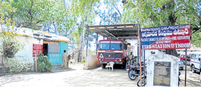
ఉట్నూర్ అగ్నిమాపక కేంద్రం

ఉట్నూర్, మార్చి 17: ఏజెన్సీ డివిజన్ కేంద్రంలో ప్రభుత్వం ఏర్పాటు చేసిన అగ్నిమాపక కేంద్రానికి పక్కా భవనం కలగలేనట్లు మిగిలింది. ఉట్నూర్ ఏజెన్సీ పరిధిలోని గ్రామాల్లో గిరిజన రైతులకు వివేకాల నుంచి పంటలు, ఇండ్లను రక్షించుకోవడానికి ప్రభుత్వం 2004 సంవత్సరంలో అగ్నిమాపక కేంద్రాన్ని మంజూరు చేసింది. కాని దానికి అవసరమైన భవనం, ఇంజనీరు నీటిని నింపుకోవడానికి వసతులు లేకపోవడంతో సిబ్బంది ఇబ్బందులు పడుతున్నారు. ప్రస్తుతం ఎంపీడీవోకు సంబంధించిన పాత శిథిలావస్థ క్వార్టర్స్లో సిబ్బంది విధులు నిర్వహిస్తున్నారు. కనీసం క్వార్టర్స్లో మరుగుదొడ్లు, నీటి వసతులు లేకపోవడంతో ఇబ్బందులు పడుతున్నారు. ఎండకాలం వచ్చినందుకే ఫైర్ ఇంజనీర్ నీటిని నింపుకోవడానికి చెరువుల చుట్టూ తిరిగి త్రవ్వడం చేస్తున్నారు. ఇది కాక 2009 సంవత్సరంలో శిథిలావస్థలో ఉన్న క్వార్టర్స్ ని సమయంలోనే కాక కాలిపోయే ప్రమాదం ఉందని ఖాళీ చేయాలని సిబ్బందికి అధికారులు హామీలు జారీ చేశారు. కాని చేసేదేమీ లేక పన్ను పరిస్థితుల్లో పాత క్వార్టర్స్లోనే కాలం గడుపుతున్నారని గతంలో 1999లో ఎంపీడీవో గ్రాండ్లో ఎమ్మెల్యే గోవింద్ నాయక్ అధ్యక్షులలో స్థలం కేటాయింపు శిలాఫలకం చేశారు. ఆ స్థల వివాదం కోర్టు అధ్యక్షులతో ఉండడంతో మూలపను దింది. మళ్ళీ ఒకసారి నిధులు విడుదలై స్థలం లేకపోవడంతో నిధులు తిరుగుపయనమయ్యాయి. తెలంగాణ ప్రభుత్వం రూ. 70 లక్షల చొప్పున రెండు సార్లు నిధులు పక్కాభవనం కోసం మంజూరు చేసింది. స్థలం లేకపోవడంతో నిధులు తిరుగుపయనమయ్యాయి. రెవెన్యూ అధికారులు స్థలం కేటాయింపడంలో అలసత్వం మహిం చడంతో మరోసారి నిధులు తిరుగుపయనమయ్యే ప్రమాదం ఉందని అగ్నిమాపక అధికారులు ఆవేదన