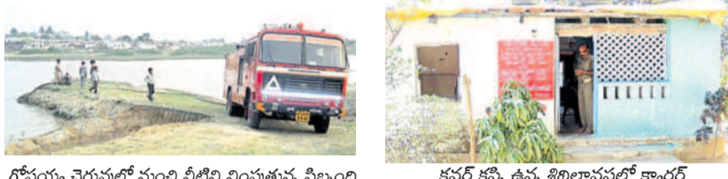
గోపయ్య చెరువులో నుంచి నీటిని నింపుతున్న సిబ్బంది

తమ సమస్యను పరిష్కరించాలని సిబ్బంది అధికారులను వేడుకుంటున్నారు. ప్రభుత్వం అగ్నిమాపక కేంద్ర భవనం నిర్మించుకునేందుకు రూ. 70 లక్షలు మంజూరు చేసింది. కాని పట్టు ణంలో రెవెన్యూ అధికారులు తమకు సరైన స్థలం కేటాయించకపోవడంతో రెండు సార్లు నిధులు తిరిగి వెళ్ళాయి. ప్రస్తుతం మళ్ళీ నిధులు వచ్చే అవకాశం ఉన్నాయి. స్థలం కేటాయింపు పక్కా భవనం కల నిరవేరుతుంది. స్థలం కోసం రెవెన్యూ అధికారుల చుట్టూ తిరుగుతున్నారు. ప్రస్తుతం ఉన్న పాత క్వార్టర్స్ పూర్తిగా శిథిలావస్థకు చేరుకున్నది. కనీసం సౌకర్యాలు లేక ఇబ్బందులు పడుతున్నాయి. చేసేవికాకపోతే ఫైర్ ఇంజనీర్ నీటిని నింపుకోవడానికే నానా తంటాలు పడుతున్నాయి. చెరువు, కుంటల నుంచి నీటిని నింపుతున్నాం. అత్యవసర అవసరాలు ఏర్పడి సమస్య నీటిని నింపడం చాలా ఇబ్బందిగా ఉంటుంది. రెవెన్యూ అధికారులు స్థలం కేటాయింపాలి. స్థలం కోసం స్థానిక ఎమ్మెల్యే చొరవ చూపాలి.